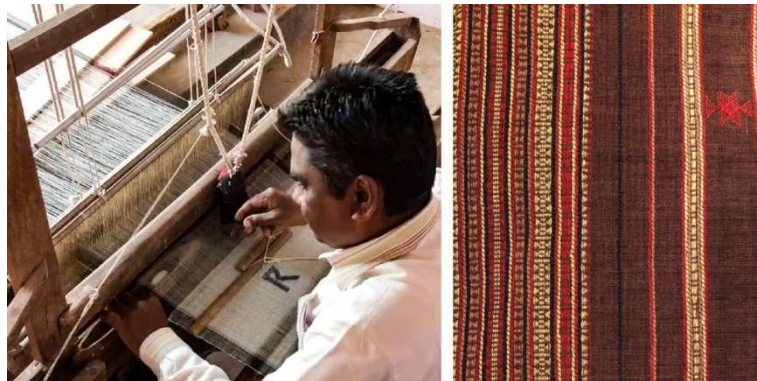
Resim.11-Hindistan'ın Kuchi Bölgesinde geleneksel olarak el tezgahlarında şallar dokunmaktadır (URL11)

5.4-Objenin Estetik Değerini Artırmak: Tekstil sektöründe üretim maliyetleri arasında yüzde beş oranında yer tutan ve genellikle form, yüzey tasarımı, materyal tasarımı gibi estetik unsurlarla uğraşan tasarım maliyetlerinin pazar payı ve değeri üzerinde etkisinin yüzde yetmiş civarında olduğu genel olarak kabul edilmektedir. Tekstil tasarımında estetik değeri üzerinde yapılan çalışmalar ürünün daha geniş kitlelerce anlaşılır olmasına ve kabul görmesine yol açacaktır. Tekstil ürününün estetik değerinde ortaya konan geliştirici bir çaba görsel etkinin tekstil ürünün bir kimlik yaratmasında etkili olacaktır. Tekstil tasarımcı toplumun genel geçer estetik değerleri ile tasarım kimliği arasında bir bağ oluşturarak objenin estetik değerinin artırılması için de gayret göstermelidir. Zira sosyologların da belirtmiş olduğu gibi estetik yargılar genellikle kabul edilebilir görsel etkinin bir sonucu olarak oluşmaktadır. Bu konuda Desert Crafts projesi verilebilir.