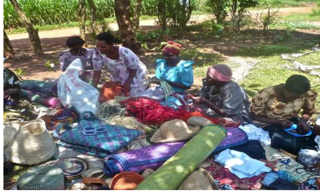
Resim.9-Namutumba 'da yöresel bir el sanatı olan bitkisel örücülük ile uğraşan zanaatkarlar. (URL8)

Tasarımcı Kirsten Scott tarafından Uganda'nın Namutumba bölgesinde Bulange yöresinde sıklıkla kişisel ihtiyacı karşılamak için yapılan geleneksel bitkisel örücülük el sanatıyla uğraşan zanaatkarlara mikro gelişim projesi aracılığıyla yeni ürünler tasarlamaları konusunda öncülük edilmiştir. Renk, form gibi estetik özellikler, pazarlama ve şapka üreticiliği alanında yeni bilgiler verilmiştir. Bu projenin sonucunda daha önceden bir gelir getirmeyen bu el sanatı yöre halkına gelir getirici ekonomik bir faaliyet haline gelmiş, Pidgin şapkaları koleksiyonu olarak sunulmuş ve yörede prestijli yarışlarda ülkenin ileri gelenleri tarafından kullanılan moda bir ürün haline dönüşmüştür (Resim.9-10).