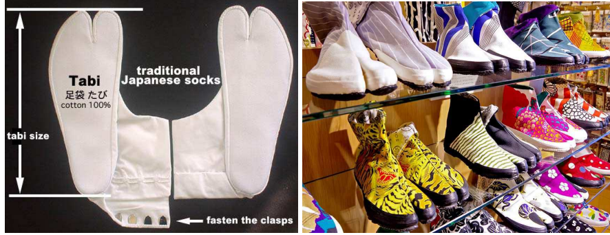
Resim.6-(solda) Geleneksel Japon çorabı tabi (URL6)

Geleneksel Japon çorapları olarak bilinen tabi, geleneksel Japon getasının içine giyilen parmak bölümü iki parçalı genellikle beyaz olan bir çoraptır. Değişen yaşam şartları sonucunda geleneksel giyimi bırakan Japonlar nedeniyle tabi Japonya'da yok olmakta olan bir el sanatları haline gelmiştir. Ancak Japonya'nın önemli bir hediyeelik eşya mağazalar zinciri Sou Sou adlı butik tasarımcıları tarafından tabi form ve renk olarak yeniden tasarlanmıştır. Japon geleneksel kumaşlarının da beyaz tabi de kullanıldığı ve düz renginden daha farklı renkli cıvıl cıvıl bir forma kavuştuğu görülmektedir. Bu durum diğer üreticilerin de benzer tasarımlar yapmasına neden olunca, tabi altına plastik bir tabanlık eklenerek bir espadril formunda ya da yeniden tasarlanarak bot, spor ayakkabı formunda üretilmiş ve satılmaktadır. Japonya'da Sou sou mağazasından sonra, Madu ve Blue & White mağazaları da dâhil pek çok satış noktasında tabi sneakers adıyla yeni bir formda daha fazla müşteri bulmaktadır.