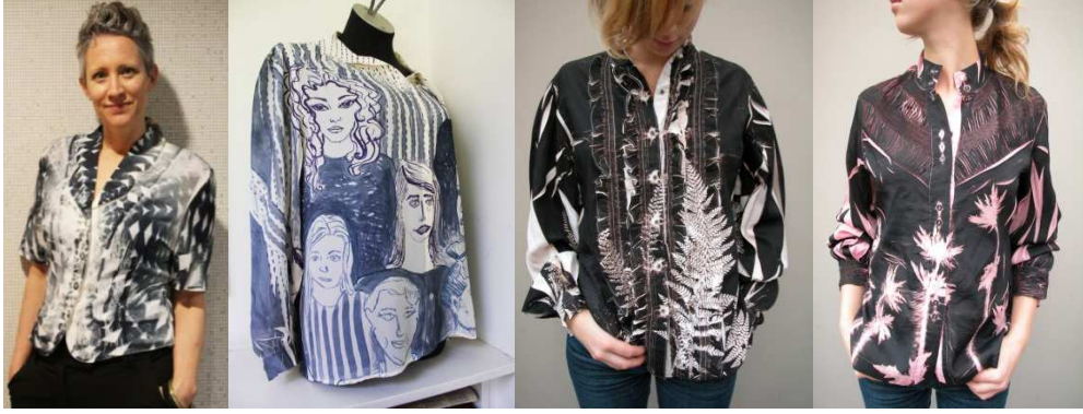
Resim.13-1999 yılında yapılan projeye ait örnekler (URL13)

kullanılan yukarı dönüşüm, hem bir ürünü oluşturmak için gereken hammadde gereksinimini azaltmakta hem de ürünlerin kullanımından doğan atık miktarını azaltmaktadır. Tekstil tasarımcısı hem geri dönüşüm hem de yukarı dönüşüm ile ilgili bir bilinç de geliştirebilir. Örneğin kullanılmış bir ürünün parçalanarak yeniden kullanılmasını ya da atıl durumda olan ürünleri hiçbir kimyasal işlemden geçirip parçalamadan malzemenin nitelikleri korunarak daha işlevsel bir ürüne dönüştürme konusunda tasarım pratikleri ortaya koyabilir. Bu duruma örnek olarak Profesör Rebecca Earley in ortaya koymuş olduğu tasarım koleksiyonlar verilebilir.