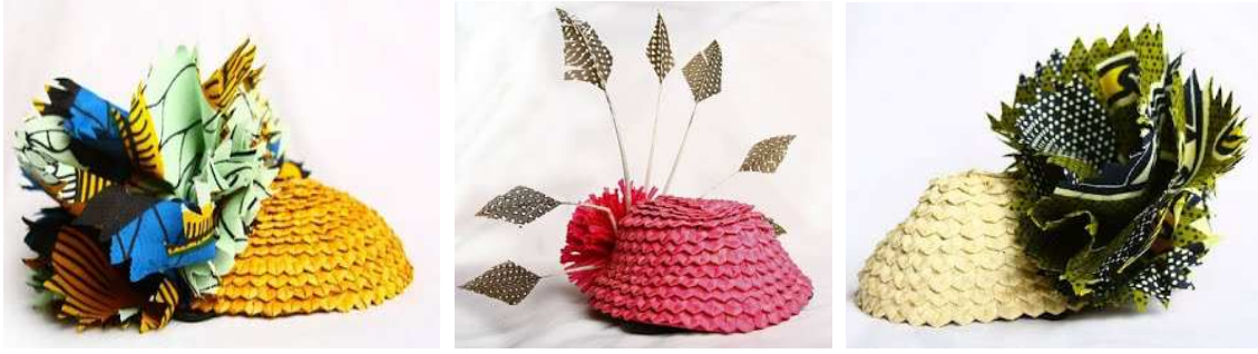
Resim.10-Pidgin Şapkalar (Pidgin Hats) olarak sunulan koleksiyon (URL9- URL10)

5.4-Objenin Estetik Değerini Artırmak: Tekstil sektöründe üretim maliyetleri arasında yüzde beş oranında yer tutan ve genellikle form, yüzey tasarımı, materyal tasarımı gibi estetik unsurlarla uğraşan tasarım maliyetlerinin pazar payı ve değeri üzerinde etkisinin yüzde yetmiş civarında olduğu genel olarak kabul edilmektedir. Tekstil tasarımında estetik değeri üzerinde yapılan çalışmalar ürünün daha geniş kitlelerce anlaşılır olmasına ve kabul görmesine yol açacaktır. Tekstil ürününün estetik değerinde ortaya konan geliştirici bir çaba görsel etkinin tekstil ürünün bir kimlik yaratmasında etkili olacaktır. Tekstil tasarımcı toplumun genel geçer estetik değerleri ile tasarım kimliği arasında bir bağ oluşturarak objenin estetik değerinin artırılması için de gayret göstermelidir. Zira sosyologların da belirtmiş olduğu gibi estetik yargılar genellikle kabul edilebilir görsel etkinin bir sonucu olarak oluşmaktadır. Bu konuda Desert Crafts projesi verilebilir.