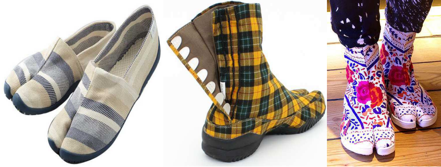
Resim.8-Espadril formunda (solda), bot formunda (ortada), spor ayakkabı formunda tabi (sağda) (URL7)

5.3-Objenin Tasarım Değerini Artırmak: Tekstil tasarımcısının bir tekstil ürünü konusunda değerlendirme yaparken geleneksel üretim yapan zanaatkârdan daha farklı bir bakış açısına sahip olması gerekmektedir. Tekstil ürünü şüphesiz işlevsel olmalı ve kullanıcının ihtiyacını gidermeli, insan yaşantısını kolaylaştırmalı, kısaca işe yaramalıdır. Ancak bunun yanı sıra tasarım değeri de taşınmalıdır. Tasarım bir problem çözme eylemidir. Problemi çözerken optimal kaynaklarla ve rasyonel kararlarla estetik sonuçlara ulaşmanız gerekmektedir. Bununla beraber, tasarımcı kendi tasarımının diğer ürünler arasında farklılaşmasını sağlamakla yükümlüdür. Bu durumda tekstil tasarımcısı kimsenin düşünmediği detaylar üzerinde durmalı, yenilikçi, güncel uyumlu, teknolojik gelişmelere uyumlu değerli ve özgün bir ürün yaratmalıdır. Ancak bu sayede bu tekstil ürünü tasarım değeri yüksek bir ürün haline gelmektedir. Teknolojik yeniliklerin gündelik kullanımı olan bir ürüne yerleştirilmesi ya da bilimsel bir buluşun bir tekstil ürününde somutlaşması ürünün başarısını artırıcı bir çaba olacaktır. Farklılaşma konusunda teknolojinin ve bilimin yarattığı ortamdan faydalanılması, moda akımlarının aradığı özelliklerle donatılması objenin tasarım değerinin artması ve muadilleri arasında tercih edilmesini artırıcı unsurlar olacaktır.