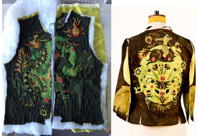
Resim.14-2014 yılında yapılan yukarı dönüşüm projesi örneği (URL14)

Rebecca Earley 2008 yılında bir grup Twice Upcycled garments (İki kez yukarı dönüştürülmüş giysiler) adlı bir koleksiyon oluşturmuştur. Giyildikten sonra hibe dükkanlarına ya da ikinci el dükkanlarına gönderilen tekstil ürünleri üzerinde çalışarak ortaya koydukları yukarı dönüşüm projesinde boyamadan sonra ağartma ya da resist boyama teknikleri kullanılmıştır. Bu projenin ilk yukarı dönüşüm katmanıdır. İkinci yukarı dönüşümde ise bir gömleğin panellerine ayrıldıktan sonra boyanması ve renklendirilmesi ve elyaf ile astarlanması ile mont ya da ceket haline dönüştürülmesi söz konusu olmuştur.