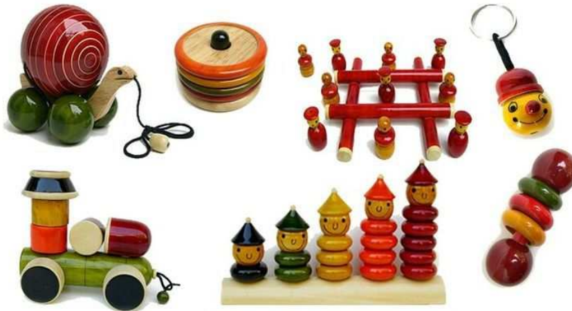
Resim.5- Chennapatna oyuncak el sanatının uluslararası satış sitesinden alınan bir göresel (URL5)

Resim.4-Maya Organics tarafından geleneksel Chennapatna el sanatının da anlatıldığı internet sayfası (URL4)