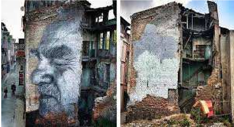
Şekil 1: JR’ın İstanbul’da Yapmış Olduğu Çalışmanın Öncesi ve Sonrası, (JR, 2015)

Bu bağlamda sokak eylemi ile sanat arasında bir köprü görevi gören ve hem legal hem de illegal olma özelliği taşıyan grafiti, proje kapsamında birçok sanatçının eserlerini icra etme yöntemi olarak karşımıza çıkmaktadır. Proje içerisinde ve Kadıköy Belediyesi tarafından düzenlenen etkinlik, planlı ve düzenlenmiş kenti eve dönüştüren, kamusal alanda kimlik gösteren ve yeniden tasarlamaya çalışan, kentsel dışavurumun bir sonucu olmuştur. Atıl durumda bulunan bina duvarlarını sınır tanımaz etkileşimin ve iletişiminin en çok yaşandığı alan olan sokaklar, toplumun kalbinin attığı en önemli yerlerdir. Pozitif etkilerin yanı sıra grafitinin ve sokak sanatının bünyesinde yasa dışı olandan yasal olmaya doğru bir sürecin işlediği görülebilir. Bizzat Kadıköy Belediyesi tarafından davet edilen yerli/yabancı birçok sanatçıların