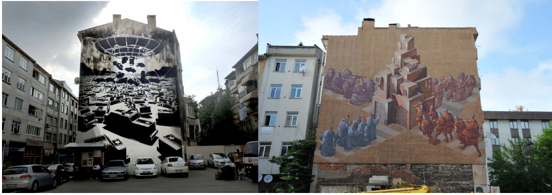
Şekil 5: Kamusal Alanların 2014 Yılında Sepe & Chazme 718 ve M-City Tarafından Yapılan Mural Çalışmalarından Sonraki Hali (M City, Common Experience, 2014).