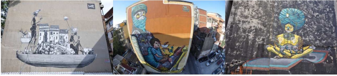
Şekil 3: Mural İstanbul Kapsamında Yapılan Çalışmalardan Örnekler (Dome, Pixel Pancho, 2012).

Mural İstanbul kapsamında yapılan eserler; kentsel alanın düzenine karşı farklı bir duruş sergileyen binaların kullanılmayan yüzeylerini yeniden düzenleme ve sahiplenme alanı olarak değerlendirilmiştir. Bu binaların yüzeylerinin değişimi, biçimlenişi ve kentsel alan içerisinde yayılması şehrin görüntüsel atmosferini değiştirecek potansiyele sahiptir. Kentin ara mekânlarında ve belirli yerlerde şekillenen sanatçıların müdahale alanları yeniden dönüşüm alanını işaret eder. Bu alanlar aynı bağlam üzerinde yer bulan dönüştürülmüş ara mekânların birbiri içerisinde kentin dokusuna alternatif bölgeler ortaya çıkarmaktadır. Mural İstanbul etkinliği kapsamında yer alan grafiti sanatçıları şehrin görünümünü değiştiren, alternatif alanlar oluşturan kişiler olarak; kentin görsel dokusuna ufak dokunuşlar gerçekleştirmişlerdir.