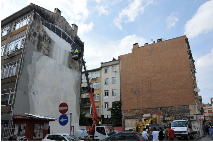
Şekil 4: Kamusal Alanların 2014 Yılında Sepe & Chazme 718 ve M-City Tarafından Yapılan Mural Çalışmalarından Önceki Hali