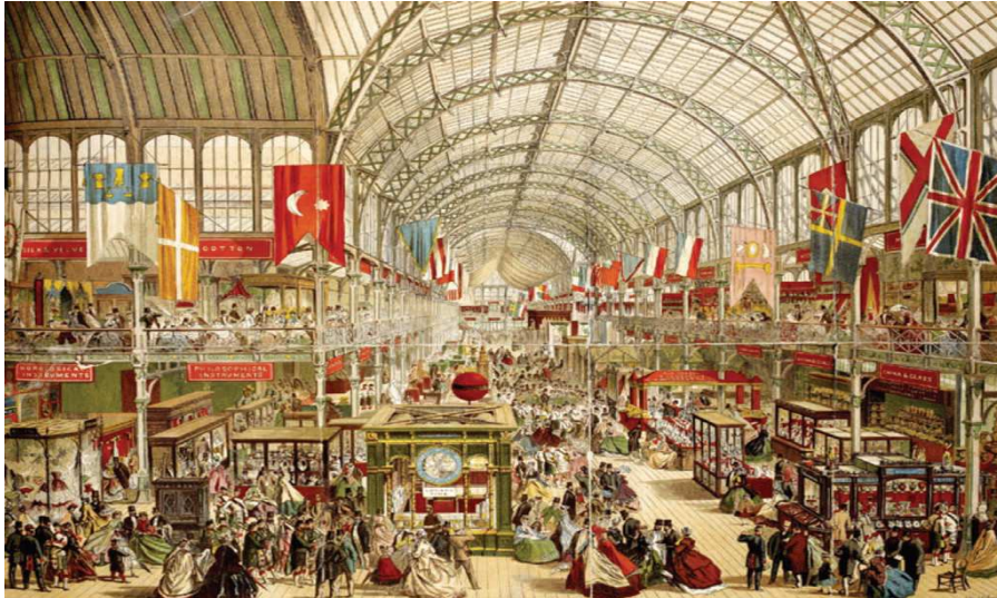
Şekil 3: 1851 Londra Exposu ve Kristal Saray (Ergüney ve Kara Pilehvarian, 2015, 228)

1851 Londra Uluslararası Sergisi'nden günümüze kadar Asya, Afrika, Amerika, Avusturya ve Avrupa'da pek çok kentte Expo düzenlenmiştir (Akyol Altun, 2003, 33). Sonuç olarak sergi alanları muazzam bir şekilde büyümüş ve tarih, kültür coğrafyası, kent araştırmaları, sanat tarihi, peyzaj mimarlığı ve mimarlık tarihi gibi farklı disiplinleri de içermektedir (Geppert et al., 2006, 5).