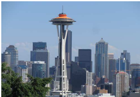
Vasco de Gama Köprüsü (URL 11) ve Uzay İğnesi (URL 12) Şekil 4: Expolardan günümüze ulaşan sembolik yapılardan bazıları

Türkiye, Tayland'ın Chiang Mai kentinde 1 Kasım 2006-31 Ocak 2007 tarihleri arasında, "To Express Love For Humanity" (insanlık için sevgisini ifade etmek) teması ve "Royal Flora Ratchaphruek 2006" adıyla düzenlenen Uluslararası Bahçe Bitkileri Sergisi'ne (Botanik Sergisi) 2000 m 2 'lik kalıcı bir Türk bahçesi ile katılmıştır (URL 8).