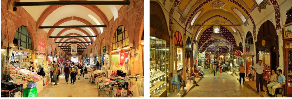
Şekil 2: Selimiye Arastası, Edirne (URL 3) ve Kapalı Çarşı, İstanbul (URL 4)

merkezlerindeki geniş alanlarda üstü açık olarak devam etmiştir. Yeni kalıcı dükkân birimleri oluşturulmuş, bu yapılar zamanla “arasta ve kapalı çarşı” haline dönüşmüştür. Arasta, Farsça “araste” (süslü) sözcüğünden gelmektedir. 15. ve 17. yüzyıl boyunca Türk kentlerine özgü mimarisi ile bilinmektedir. Kapalı çarşılar ise sokak ve dükkân üstlerinin kubbe, tonoz ve ahşap çatılarla örtülü olduğu çarşı bölgesidir. 15. yüzyılda İstanbul’da II. Mehmet döneminde yapılan Kapalı Çarşı (Şekil 2), Türkiye’de yapılan ilk ve en büyük kapalı çarşı örneğidir (Topçu, 2011, 61).