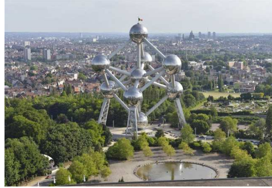
Eyfel Kulesi (URL 9) ve Atomium (URL 10)