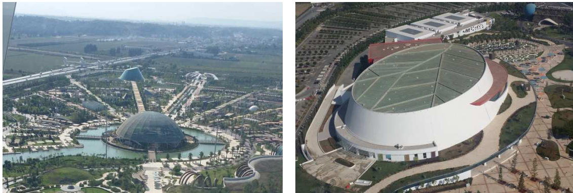
Şekil 9: Çocuk Adası ve Kongre Merkezi (Orijinal, 2017)