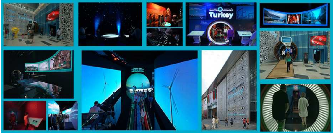
Şekil 6: Expo 2017 Astana'daki Türkiye pavyonu (URL 13)

Türkiye'nin son katıldığı Expo, 2017 yılında Kazakistan'da düzenlenen Uluslararası Tescillenmiş Sergi kategorisindeki Expo 2017 Astana'dır. Türkiye, "Sürdürülebilir Enerji için Küresel Sinerji" teması ve "Enerjinin Merkezi: Türkiye" sloganıyla katılmıştır (Şekil 6).