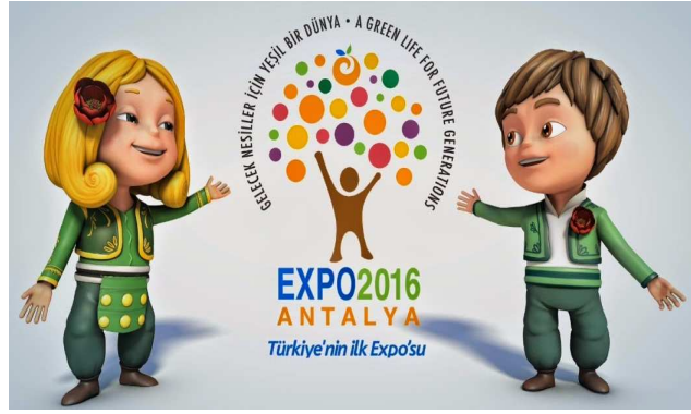
Şekil 7: Expo 2016 Antalya'nın logosu ve maskotları Ece-Efe (URL 5)

112 ha'lık alanda 50 den fazla ülkenin katılımıyla gerçekleştirilmiştir. Serginin sembolü, Şakayık Çiçeği; maskotları ise Yörük kıyafetli "Ece" ve "Efe" isimli iki çocuktur (Şekil 7). "Gelecek nesiller için yeşil bir dünya oluşturmak" hedefiyle düzenlenen Expo 2016 Antalya'nın alt temaları "tarih", "biyo-çeşitlilik", "sürdürülebilirlik" ve "yeşil şehir" dir.