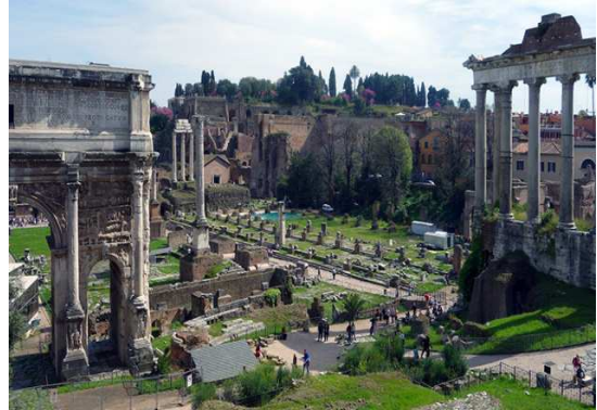
Şekil 1: Efes Ticari Agorası, İzmir (URL 1) ve Roma Forumu, İtalya-Roma (URL 2)

Ortaçağ Avrupa'sında ticari faaliyetler başta katedraller ve şatolar çevresi olmak üzere kent