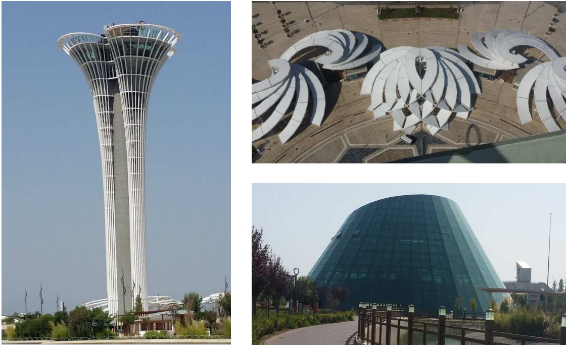
Şekil 8: Expo Kulesi, ana giriş kapısı ve Yağmur Ormanları Serası (Orijinal, 2017)