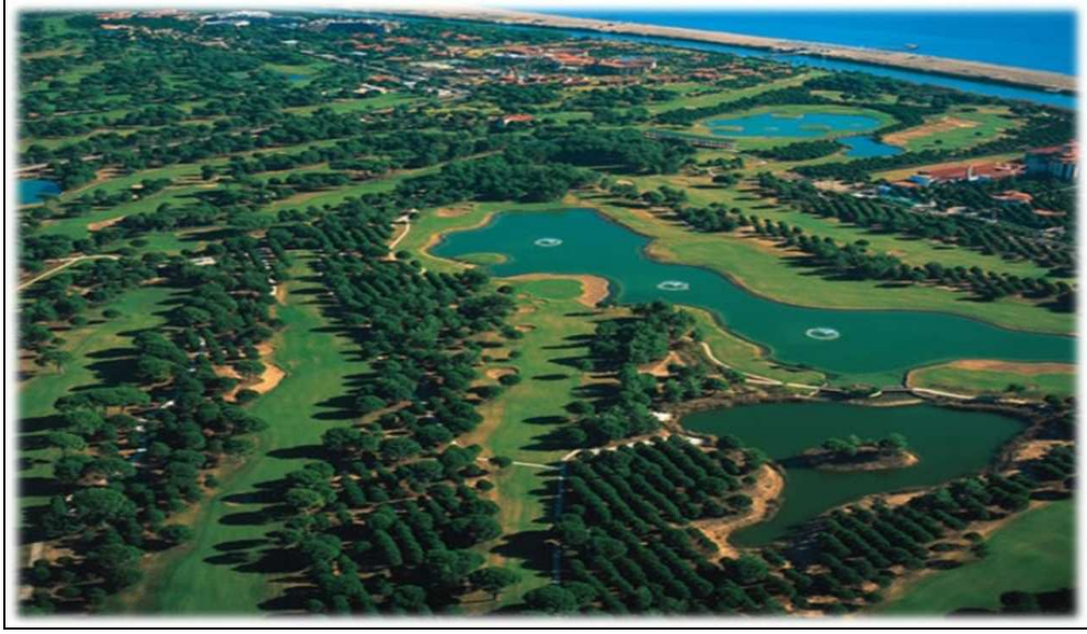
Şekil 2: Belek (Antalya) Golf Turizmi Merkezi.