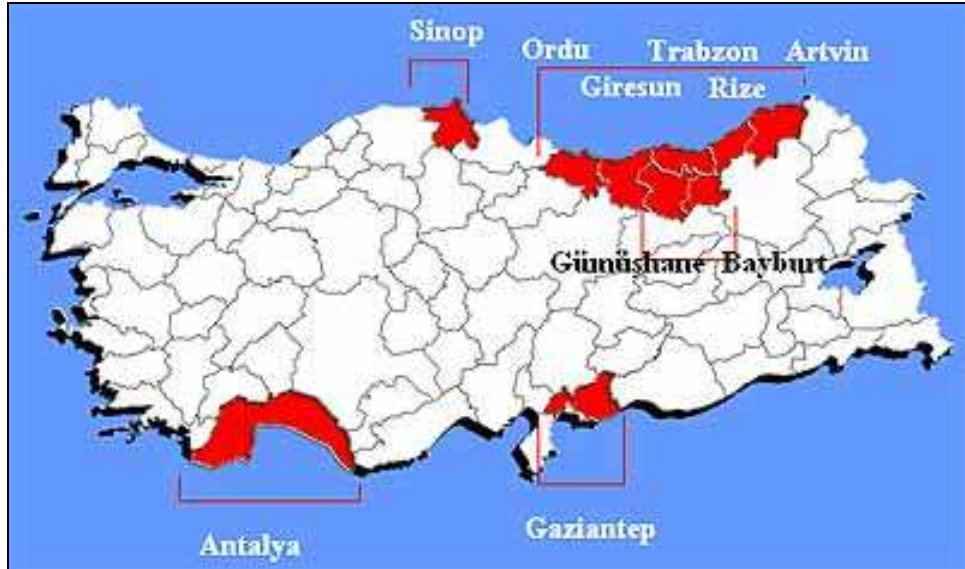
Şekil 3. Yayla Turizm Merkezleri.

Plato ile eş anlamlı olarak da kullanılan yayla, değişik yükseltide yer alan ve akarsular tarafından derin bir şekilde yarılan düz veya hafif dalgalı arazi olarak tanımlanmaktadır (Hoşgören, 2014: 251). Yaylalar, son yıllarda rekreasyonel amaçlı olarak kullanılmaktadır. Günümüzde şehirlerde yaşayan insanların çevre kirliliğinden bunalıp doğal ortamlara yönelmektedirler. Yaylalar, kirlenmemiş havası, yazın en sıcak günlerde ferahlatıcı serinliği, billur gibi soğuk suları, çok çeşitli bitki örtüsüne sahip olması, doğanın tabii ortamlarında yetişen hayvanlardan elde edilen gıdaları, doğal meyve ve sebzeleri, flora ve fauna zenginlikleri, hidrografik güzellikleri, sosyal ve kültürel değerleri, çeşitli spor etkinlikleri, şifalı suları ve sahane manzaralarıyla bölgelerin turizm çekim merkezi ve gözde mekânlarıdır.