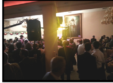
Resim 3 ve 4. Tahran'da bir Zerdüşti düğünü.

Oyun-eglence bittikten sonra geç saatte gelin ve damada hediye, para verme zamanı başlar. Bunun adı, Pâtehtî törenidir. Bu tören, Yezd gibi yerlerde düğünden sonraki günün akşamında yapılır. Pâtehtî törenine bağımsız başlık altında daha sonra değineceğiz.