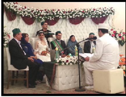
Resim 1. Tahran'da bir nikah töreni.

Môbed, nasihatten sonra Ameşâspendlerin 16 isimlerini, bunların insan davranışlarına etkilerini açıklar. Gelinden, damattan hayatlarında onların ifade ettiği mesajlara uymalarını söyler. Behmen, barış ve iyi düşünceyi, Erdîbehişt doğruluk ve temizliği, Şehrîver gücünü, sorumluluğunu bilmeyi, Spendormezd mütevaziliği ve merhameti, Hordâd mutluluğu ve huzuru, Amordâd sağlıkla uzun yaşamı temsil etmektedir. En sonda môbed tekrar gelin ve damada birbirilerini özgürce kabul edip etmediğini sorar. Onlardan evet cevabını aldıktan sonra, Hord Avesta 'dan Tendürüstî 'yi okur, ayağa kalkar sofrada içinde pirinç, arpa ve kekik olan tabağı alır, karışımı gelinle damadın başına omzuna serper. Onlar için sağlık, uzun ömür, mutluluk dileğinde bulunur. Nikâh işlemi tamamlandıca gelinle damadın yüzüne ayna tutulur, onlara gül suyu, tatlı ikram edilir. Ardından gelin ve damat birbirine beyaz leblebi yedirir (Ayrıca bkz. Niknâm, 1392/2013: 65-70).