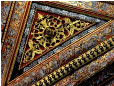
Görsel 13: Ahşap tavan köşelik bezemeleri

Kare tavan, ortada bulunan sekizgen çökertme, kenarlarında bordür kuşakları ile çerçeve içerisine alınmıştır (Görsel: 11). Kuşaklar bir birlerinden ince silme bordür kuşaklarla ayrılmıştır. Silme bordürler iki sıralı sade ya da ahşap oyma tekniği ile yapılmış geometrik motifli ve verevli olarak düzenlenmiştir. Sekizgen ve dört şeritli kuşaktan en dışta olan şerit kırmızı zemin üzerine ajur tekniği yapılmış çiçek motiflerinin tekrarından oluşturulmuştur. Diğer üç şerit üzerinde bulunan süslemeler ve renkleri, kenar çerçeve kuşaklarda olduğu gibi natüralist çiçekler ve meyvelerin tekrarı şeklinde düzenlenmiştir (Görsel: 14). Köşelerde oluşan dört adet üçgen köşelik; mavi astar renkli bir zemin üzerine yapılmış olan beyaz renkli çiçeklerin oluşturduğu üçgen bir kuşak ile çevrelenmiş olan alan içerisindeki süslemeden oluşmaktadır. Silme, burgulu şekilde ayrılan üçgen alanın tam ortasında bulunan bir kabara etrafına ajur tekniği ile yapılmış ve üçgen alanı dolduracak şekilde dağılan kıvrık dal ve yapraklardan oluşmaktadır (Görsel: 13).