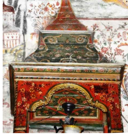
Görsel 2: Minber köşkü bezemeleri

Harimin kuzey duvarı boyunca yatay bir şekilde uzanan kadınlar mahfili, ahşaptan yapılmıştır. Mahfilde iki duvar kenarı ile ortadan harime doğru kare planlı üç balkon çıkıntısı bulunmaktadır. Mahfil ahşap ayaklarla desteklenmiştir. Edirnekâri bezemeler ahşap balkonun alınlık yüzeylerinde ve mahfilin tavan kısmında yoğunlaşmıştır. Korkulukların altındaki içe meyilli oluklu silme şeklinde iki alınlık, çıkıntı oluşturan üç balkonda da gezinmektedir. Bu alınlık yüzeyi kırmızı zemin renk üzerine yapılmış olan ortada iki tarafa doğru açılan yapraklar ile beyaz yasemenlerin oluşturduğu çiçek demetlerinin tekrarı ile yapılmış düzenlemeden oluşmaktadır. Bunun altında yer alan ve duvarlarda bulunan iki sütun boyunca uzanan ikinci bir kuşak ise zeytin yeşili bir zemin rengi üzerine yapılmış olan bitkisel düzenlemeden oluşmaktadır. Ortada bulunan balkon çıkıntısı iki aşamalı bir şekilde yukarı doğru kademelendirilmiş olup ikinci bir alınlık kuşağı ile desteklenmiştir. Bu kuşak açık mavi astar rengi üzerine ortadan sağa sola hareket eden kıvrık dallar ve çiçekler ile doldurulmuştur. Bu ikinci çıkıntılı kısmın altında oluşan dikdörtgen yüzeyi ise, sağa ve sola uzanan çiçekler ile bezenmiştir. Mahfil tavanları ise, lacivert renkli ve üzerine sürülen krem rengi ile hazırlanmış astardan oluşmaktadır Zemin üzerine ortada bir çiçek ile etrafını kuşatan farklı tarzdaki çiçeklerin oluşturduğu çelenk şeklindeki bir düzenlemeden oluşmaktadır (Görsel: 3).