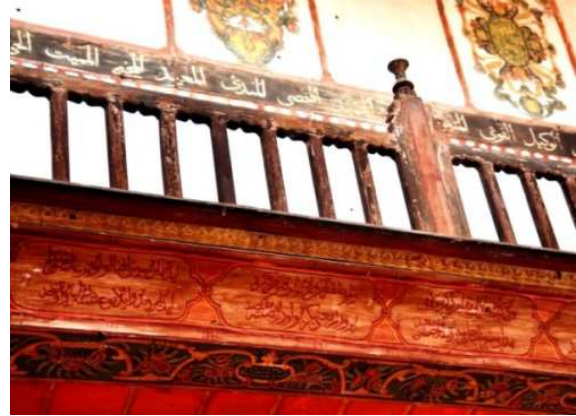
Görsel 10: Mutrib mahfili alınlık bezemeleri

İkinci kuşak tavan kenarlarından başlayan koyu kırmızı bir astar boya üzerine 'C' kıvrık dallarının yatay şekilde yana yana gelmesi ile oluşturulmuş stilize sepetlerin aralarına yerleştirilen bitkisel bezemelerden oluşturulmuştur. Barok tarzında natüralist bir üslupta yapılmış olan çiçekler, ağırlıklı olarak güllerden oluşmaktadır. Pembe ve mavi renklerin ağırlıklı olarak kullanıldığı kuşakta zemin rengi belli bölgelerde zaman zaman mavi renge dönüşmektedir. Üçüncü kuşak, iki sade silme çıta ile kuşatılmış, toprak renkli bir zemin rengi üzerine dikdörtgen ve kare şeklinde kartuşlar içerisine kırmızı ve pembe güller ile yeşil yapraklardan oluşan natüralist çiçekler yerleştirilmiştir. Dördüncü kuşak, açık mavi astar bir boya üzerine yıldızlı kıvrık dallar ile bunlar arasına yerleştirilmiş güller ve yapraklardan oluşmaktadır. Kırmızı, pembe natüralist çiçekler ile yeşil yapraklardan tekrarından oluşmaktadır. Beşinci kuşak, daha içeride ve daha dikey olarak yapılmış olup, açık mavi bir zemin astar rengi üzerine kıvrık dalların kuşak üzerinde oluşturduğu stilize sepet ve vazolar içerisinde meyve ve çiçekler bulunmaktadır.