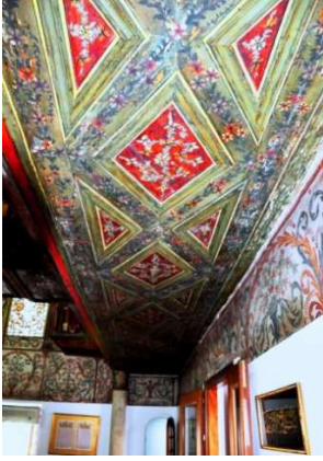
Görsel 5: Kadınlar mahfili bezemeleri

çelenk şeklinde düzenlenmiştir. (Görsel: 4) Gül, lâle, karanfil gibi çiçekler ve yapraklardan oluşturulmuş natüralist bir çiçek buketi şeklinde düzenlenmiştir. Aralarda kalan kısımlardaki bezemeler birbirlerine benzer barok karakterli yapraklar ile bezelidir. Mahfil tavanının çevresi sarı renkli düz silmelerle çevrenmiştir (Görsel: 5). Bu tavanın ortasında ahşap mahfilin alınlarında, küçük çiçek buketleri ve barok yapraklar yer almaktadır (Uçar, 2013: 122). Harim kısmına uzanan mahfillerin yukarısında kalan duvarlarda, pencereler ve araları barok karakterli kıvrımlarla büyüklü küçüklü panolara bölünmüş, panoların bazılarının içinde batı tarzında bir tablo gibi işlenmiş natüralist çiçekler bulunan yuvarlak madalyonlara yer verilmiştir (Görsel: 6).