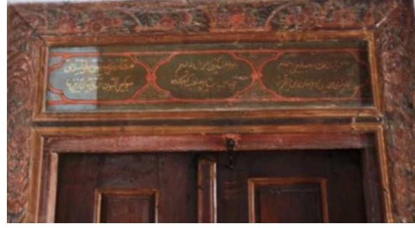
Görsel 8: Semahane dolap üzeri bezemeler

Semahane mekânı içerisinde ahşap üzerine kalemişi süslemelerin bulunduğu bir başka unsur mutrib mahfilidir (Görsel: 9). Kuzey duvarı ile batı duvarı ortasına kadar uzanan "L" planlı mahfil, duvardan mekân içine doğru iki metrelik bir çıkıntı oluşturacak şekilde yapılmıştır. Zeminden desteksiz olarak doğrudan duvara monte edilen mahfil, alt kısımları eğimli şekilde yapılmıştır. Eğimli yüzeylerin üzeri çitakârî tekniği ile eşit karelere bölünmüş ve içleri bitkisel motiflerle bezenmiştir. Bezemeler kırmızı astar zemin üzerine natüralist çiçek ve yapraklardan oluşmaktadır. Alınlık kısmında ki alt sıra bordür, barok tarzında bitkisel motifler ile aralarında meyve ve çiçekler tasvirlerinin tekrarından oluşturulmuştur. Üst sırada bulunan bordür kuşağında yatay dikdörtgen şekilli kartuşların tekrarından oluşan bir düzene sahiptir. (Görsel: 10).