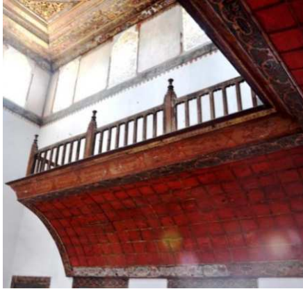
Görsel 9: Mutrib mahfil bezemeleri

Semahâne içerisinde ahşap üzerine yapılan edirnekârî bezemeler açısından en yoğun yer olan ahşap tavadır. Kenarlarını kuşatan çerçeve şerit üzerinde birbirini belirli aralıklarla tekrar eden edirnekârî bezemelerle başlamaktadır (Görsel: 11). Bezemeler lacivert bir zemin rengi üzerine şerit boyunca devam eden stilize kıvrık dalların oluşturduğu sepetler içerisinde bulunan çeşitli meyvelerden oluşmaktadır. Doğal renklerinde yapraklı olarak yapılmış meyveler; elmalar, erikler, şeftaliler, armutlar, karpuzlar ve narlardan oluşmaktadır (Görsel: 12). Meyvelerin etrafında, farklı meyve çiçeklerinden oluşan bitkisel bezemeler yer almaktadır. Bu kuşağı alt kısımda püskül şeklinde tasvir edilmiş tavan eteği, üstte ise ağaçtan burgulu şekilde yapılmış ince bir silme çepeçevre kuşatmaktadır (Görsel: 12).