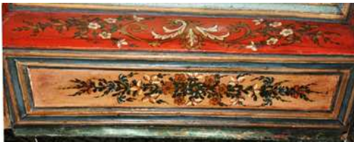
Görsel 3: Kadınlar mahfili alınlık bezemeleri

Harimin kuzey duvarı boyunca yatay bir şekilde uzanan kadınlar mahfili, ahşaptan yapılmıştır. Mahfilde iki duvar kenarı ile ortadan harime doğru kare planlı üç balkon çıkıntısı bulunmaktadır. Mahfil ahşap ayaklarla desteklenmiştir. Edirnekâri bezemeler ahşap balkonun alınlık yüzeylerinde ve mahfilin tavan kısmında yoğunlaşmıştır. Korkulukların altındaki içe meyilli oluklu silme şeklinde iki alınlık, çıkıntı oluşturan üç balkonda da gezinmektedir. Bu alınlık yüzeyi kırmızı zemin renk üzerine yapılmış olan ortada iki tarafa doğru açılan yapraklar ile beyaz yasemenlerin oluşturduğu çiçek demetlerinin tekrarı ile yapılmış düzenlemeden oluşmaktadır. Bunun altında yer alan ve duvarlarda bulunan iki sütun boyunca uzanan ikinci bir kuşak ise zeytin yeşili bir zemin rengi üzerine yapılmış olan bitkisel düzenlemeden oluşmaktadır. Ortada bulunan balkon çıkıntısı iki aşamalı bir şekilde yukarı doğru kademelendirilmiş olup ikinci bir alınlık kuşağı ile desteklenmiştir. Bu kuşak açık mavi astar rengi üzerine ortadan sağa sola hareket eden kıvrık dallar ve çiçekler ile doldurulmuştur. Bu ikinci çıkıntılı kısmın altında oluşan dikdörtgen yüzeyi ise, sağa ve sola uzanan çiçekler ile bezenmiştir. Mahfil tavanları ise, lacivert renkli ve üzerine sürülen krem rengi ile hazırlanmış astardan oluşmaktadır Zemin üzerine ortada bir çiçek ile etrafını kuşatan farklı tarzdaki çiçeklerin oluşturduğu çelenk şeklindeki bir düzenlemeden oluşmaktadır (Görsel: 3).