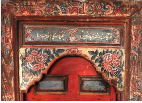
Görsel 7: Semahane kapı bezemeleri