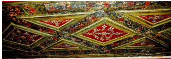
Görsel 4: Kadınlar mahfili Tavan bezemeleri

Kadınlar mahfili tavanları ile sütunların taşıdığı çıkıntılı bölüm haricindeki harime bakan bir alt alınlık tavan altı, nefli yeşil astar boya ve üzerinde, bitkisel motifler, natüralist çiçekler ve yapraklardan oluşan bezemeler işlenmiştir. Mahfil tavan kısmı uzun bir dikdörtgen şeklinde bir halı bordürü gibi bezenmiştir. Çift sıra silme çıtalarla yapılmış olan altı adet baklava dilimi ile kenarlarında yarım (üçgen) baklava dilimleriyle tamamlanmıştır. Baklava dilimlerinin ortası çiçeklerden oluşan bir bezeme zinciri