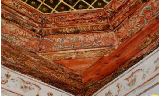
Görsel 15: Zekâtlar konağı baş oda tavan köşeliği

içlerinde göbekler yerleştirilmiştir. Tavanın kuzeybatıda bulunan kısmı, kalemişi bezemeli iç içe iki sıra bordürün önde kare, iç kısımda ise sekizgen çerçeve ile kuşatıldığı çökertme ile yüzeyinde yatay dikey çıtaların kesişmesi ile oluşan geometrik bir düzenlemeye sahiptir (Görsel: 16). Yüzey yatay ve dikey şekilde çıtalarla küçük karelere bölünmüş ve içlerine kalemişi tekniğinde çiçek motifleri nakşedilmiştir. Sekizgen çökertme içinde yine sekizgen bordürlerle kuşatılmış daire şeklinde tavan göbeği yer almaktadır. İçten ve dıştan iki burgulu silme çıta ile çerçeve içerisine alınmış sekizgen bordür içlerinde her birine birer olmak üzere sekiz adet kartuş yerleştirilmiştir. Tavan göbeğinin sekizgen bordürlü kısımlarının içine ve tavan göbeğinin ortasına ise yuvarlak bordürler içerisine alınmış on kollu yıldız motifinden oluşan bir geometrik motif yerleştirilmiştir.