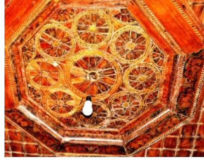
Görsel 16: Zekâtlar konağı tavan bezemeleri

Sekizgen çökertme kenarında bulunan dört sıra içe doğru kademelendirilmiş bordür içlerinde benzer renklerle yapılmış bezeme anlayışı görülmektedir. Bu kısımda bulunan ilk bordür diğerlerinden daha geniş tutulmuş ve mavi kırmızı güllerin tekrarından oluşan bir düzenleme anlayışı hâkimdir. İkinci kuşak ise, güllerin yatay bir şekilde birbirlerine eklenmesinden oluşturulmuştur. Farklılık gösteren üçüncü kuşak ise alt ve üst kısımda zikzak şeklinde uzanan üçgenlerin oluşturduğu geometrik bir düzene sahiptir. Dördüncü kuşak ise ters ve düz kıvrık 'C' şekilli yatay palmet şekilli dalların boşluklarına yerleştirilmiş kırmızı güllerin tekrarından oluşturulmuştur (Görsel: 17).