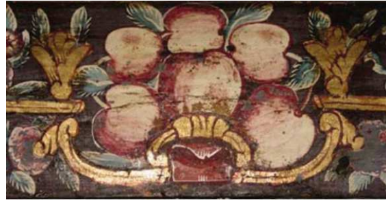
Görsel 14: Tavan edirnekârî bezeme (detay)