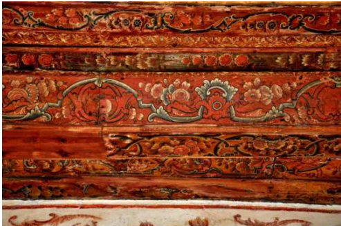
Görsel 17: Zekâtlar konağı baş oda tavan bezemeleri

Başoda içinde yer alan ahşap dolaplar dikdörtgen ve karelerden oluşan düzenlemeye sahiptir. Ahşap dolapların üzerinde her hangi bir bezeme unsuru bulunmamaktadır. Bu dolapların yapının yenileme sırasında yeniden yapıldığı düşünülmektedir (Görsel, 19). Alt kısımdaki kalın duvarlar üzerine yapılan ahşap geçmeli ve demir görünümlü pencerelerin korkulukların çoğu ise sağlam şekilde durmaktadır. Paravan kısmında bulunan edirnekârî bezemeler tavanda bulunanlara nazaran daha basit ve amatörce yapılmış etkisi bırakmaktadır. Bezemeler bitkisel motiflerden oluşmasına rağmen oldukça yıpranmış ve soluklaşmıştır. Üzerine sürülen lakenin silinmesinden kaynaklı olsa da bezeme altına astar boya ve son olarak ta lake sürülmemesi bu kısmı yapanların amatör ustalar tarafından yapıldığını göstermektedir.