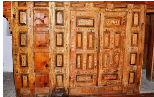
Görsel 18: Zekâtlar konağı başoda ahşap paravan bezemeleri

Edirnekârî bezemeleri açısından Ergirikasrı'nda günümüze gelmiş tek örnek olmasına karşın, eski Fotoğraflardan anlaşıldığı kadarıyla Babameto, Skenduli gibi Polarto mahallesindeki birçok konakta edirnekârî bezemelerin kullanılmış olduğu anlaşılmaktadır. Bugün çoğu yıkılmış yıpranmış ya da