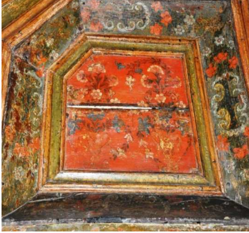
Görsel 1: Minber yan aynalık bezemeleri detay

Çemberin etrafından dört yana dağılan kırmızı goncalar ise baklava dilimli kırmızı renkli bir çıta ile kuşatılmaktadır. Köşkün kare planlı tavanına çapraz şekilde yerleştirilen bu şekil ile kenarlarda oluşan üçgen alanların içerisine ise yeşil yapraklı kırmızı gül demetleri tasvir edilmiştir (Görsel: 2). Köşk altı, batıdaki tamamen silinmiş olup doğudaki ortada bulunan kare planlı ve kırmızı astar renkli bir yüzey üzerine iki demet çiçek yerleştirilmiştir. Kırmızı, mavi, mor, pembe renklerden oluşan karanfiller, hanımeli, gibi çiçeklerden oluşmaktadır. Bu alanın etrafında yer alan bordür ise kartuşlar ve etrafına yerleştirilmiş olan çiçek ve yaprakların düzeninden oluşmaktadır. Ağaçtan yapılmış olan minberin kapısı, alt tarafta kare prizmal başlayan ortada silindirik gövdeye dönüşen iki sütun üzerine üç dilimli kemerden oluşmaktadır. Kemerlerin üzerinde ise yarım daire planlı bir tepelik ile yanlarda birer başlıktan oluşmaktadır. Edirnekâri bezemeler, sütunları sarmal şekilde kuşatan sarmaşıklar ile kemer köşeliklerini her iki yandan kuşatan çiçekler bulunmaktadır