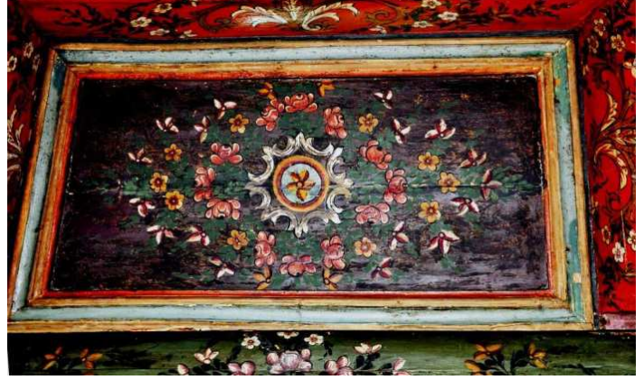
Görsel 6: Kadınlar mahfili bezemeleri