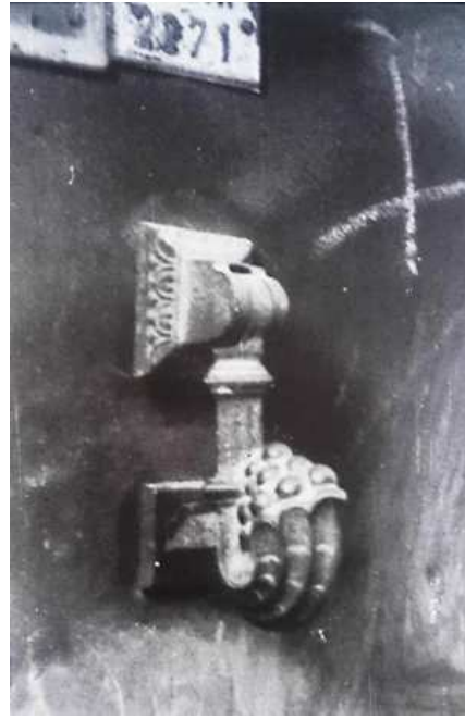
Resim 14. (sağda) Yusuf Paşa Mahallesi. Zincirli Sokağı'nda günümüzde kaybolmuş olan üzüm motifli kapı tokmağı.

Şanlıurfa'da görülen üçüncü ve bir diğer kapı tokmağı tipini ise bitki motifli olanlar oluşturmaktadır. Genellikle döküm tekniğiyle yapıldıkları görülen bu kapı tokmaklarının "bir meşe yaprağına benzer tipi dışında tamamı Avrupa'dan ithaldir. Bu tipte ise S kıvrımları bir meşe yaprağını andırarak şekilde düzenlenmiştir" (Kolektif:1999) (Resim 13).