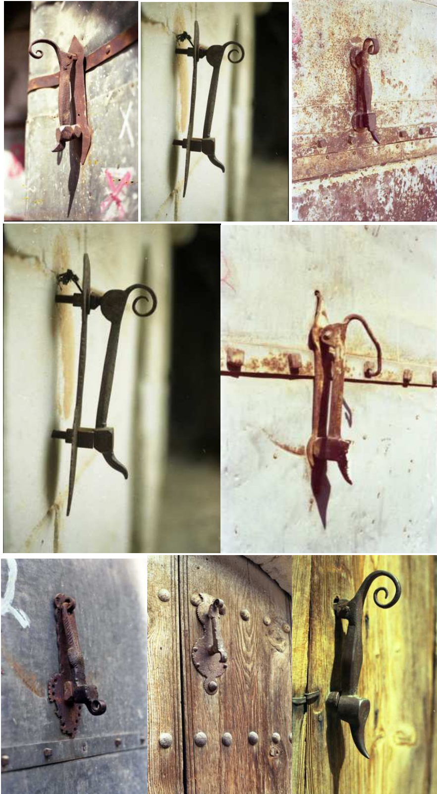
Resim 12. Geleneksel Urfa evlerinin kapı tokmaklarından günümüzde kaybolmuş örnekler. Hepsinde sürüngen bir hayvan stilize edilmiştir

Bu tasarımlarda bir soyutlama görölmektedir. Hatta bu soyutlamalar o kadar güçlüdür ki, ilk bakıldığı anda soyutlanan hayvanın türü çođu zaman anlaşılmamaktadır. Örneđin genellikle kuşların ya da sürüngen hayvanların stilize edildiđi bu tasarımlarda ancak başında bulunan ibiđi ile bir horozun soyutlandığı anlaşılabilmektedir (Resim 11). Bu tasarımların kökeni ise "Orta Asya Türkleri tarafından kullanılan hayvan üslubuna kadar uzandırılmaktadır" (Birdevrim, 2008:76).