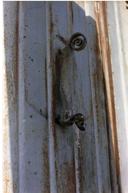
Resim 8. Geleneksel Urfa evlerinin kapı tokmaklarından günümüzde kaybolmuş bir örnek. Ördek başlı, sürüngen kuyruklu bir hayvan stilize edilmiştir