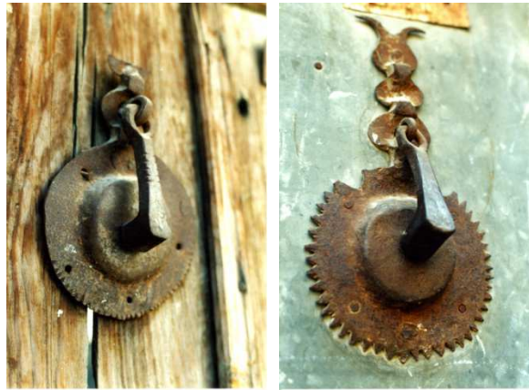
Resim 15: Geleneksel Urfa evlerinin kapı tokmaklarından günümüzde kaybolmuş çekeç tipli iki örnek.

Şanlıurfa'da görülen üçüncü ve bir diğer kapı tokmağı tipini ise bitki motifli olanlar oluşturmaktadır. Genellikle döküm tekniğiyle yapıldıkları görülen bu kapı tokmaklarının "bir meşe yaprağına benzer tipi dışında tamamı Avrupa'dan ithaldir. Bu tipte ise S kıvrımları bir meşe yaprağını andırarak şekilde düzenlenmiştir" (Kolektif:1999) (Resim 13).