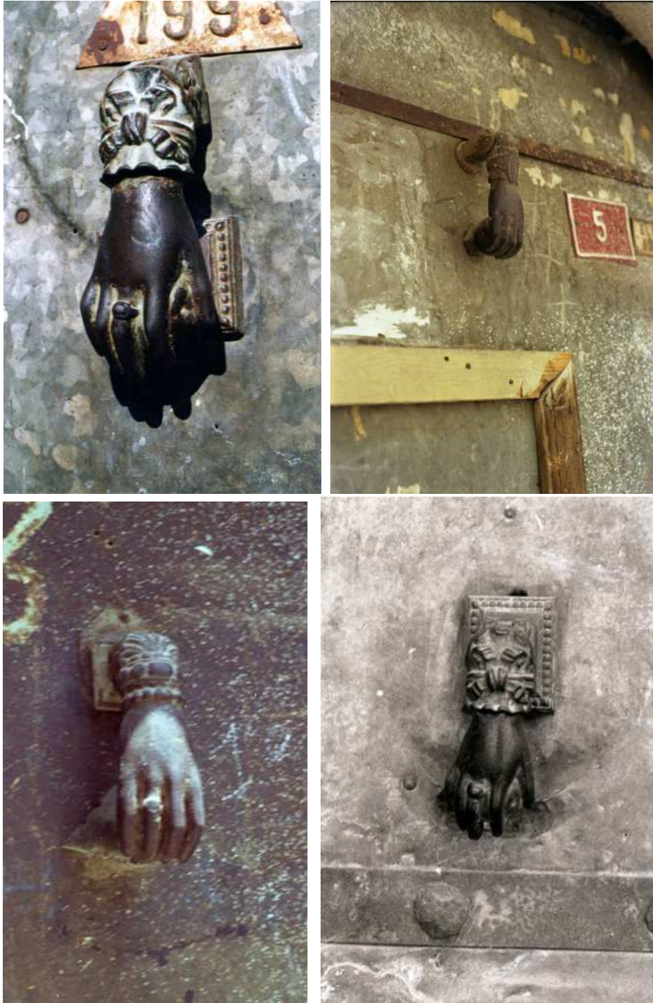
Resim 5: Geleneksel Urfa evlerinin kapılarında sıkça görülen, ancak birçoğu günümüzde kaybolmuş olan hanımeli tipi kapı tokmakları.

Hafif yumru şeklinde olan bu elin içinde ise bir top vardır. Bu topun iyiliđi, bolluđu bereketi, sonsuz yařamı çağrıřtıran nar meyvesi olduđu söylenmektedir (Birdevrim, 2008:80). Buna göre; “kiřinin içeridekilerle ilk teması bu bereket sembolünü tutan ele dokunarak başlar” ve ev sahibinin bu hümanist karřılaması misafire karřı iyi davranılacađının temini olarak bir el biçiminde somutlařır (Anonim:2012).