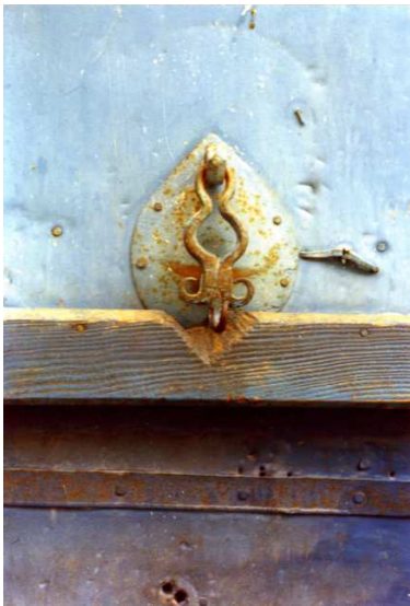
Resim 10: Geleneksel Urfa evlerinin kapı tokmaklarından günümüzde kaybolmuş bir örnek. Kurbağaya benzer bir hayvan stilize edilmiştir (Fotoğraf: A. Cihat Kürkçüoğlu/1985).

Bu insan eli biçimindeki kapı tokmakları dışında yaygın olarak görülen ikinci tipi ise soyut hayvan biçimli tokmaklar oluşturmaktadır. Yine çok değişik ölçülerde gördüğümüz bu tokmaklar da dövme tekniğinde yapılmış olup, genel olarak dikdörtgen bir demir parçasının üst kısmı kuyruk, alt kısmı baş şeklinde biçimlendirilerek tasarlanmışlardır.