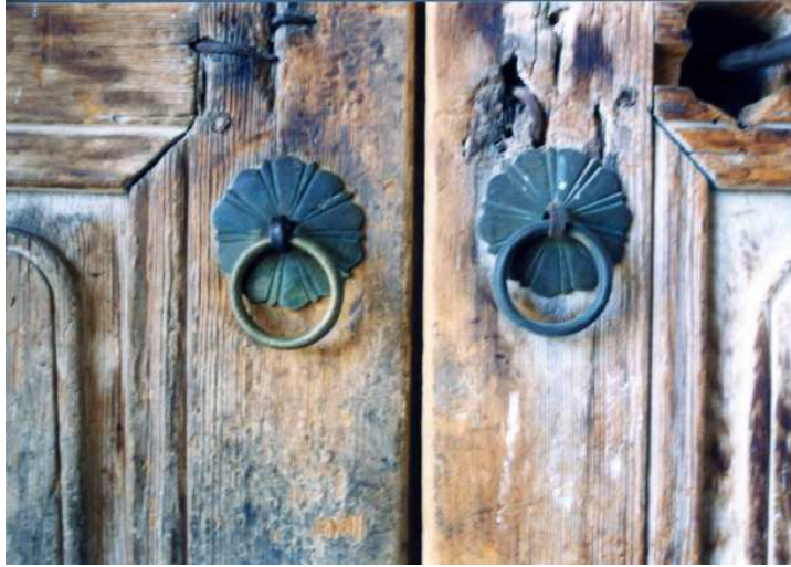
Resim 17: Yıkılmış bir Urfa evinde çift kapı çekeceği. (Fotoğraf: A. Cihat Kürkçüoğlu/1976)

İkinci tip kapı halkaları ise, damla biçimlidir . Bu kapı halkaları bir kalp şeklini andırmaktadır (Resim 16).