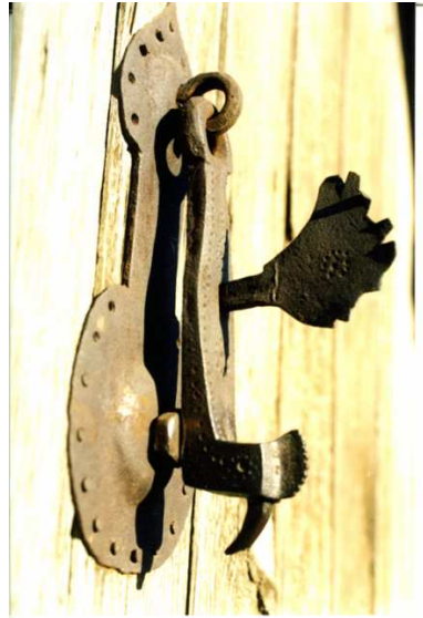
Resim 11. Geleneksel Urfa evlerinin kapı tokmaklarından günümüzde kaybolmuş bir örnek. Horozu andıran bir hayvan stilize edilmiştir. (Fotoğraf: A. Cihat Kürkçüoğlu).