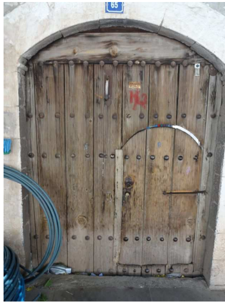
Resim 1: Tahta sokak kapısı, çift çenetli(kapılı), enikli kapı örneği, Şanlıurfa.

Mimaride ise kapı, bir yanılsama ya da kavram olmaktan sıyrılarak ilk olarak doğrudan vücutların işe karıştığı ve insan biçimli dikey sisteminden fiziki geçişlerin gerçekleştiği, varolma nedeninin kendisi olduğu üç boyutlu bir öge olarak karşımıza çıkmaktadır. Bu maddi fiziksel gerçekliğiyle kapı mahremiyet ve güvenliğin birinci sırada olduğu eski anlamda ikamet etme amacına hizmet etmektedir. Bu anlamda dikkate değer sivil mimari örneklerine sahip şehirlerden biri olan Şanlıurfa evlerinde mimari bütünün parçalarından biri olarak sokaktan avluya açılan, atların ve arabaların da geçebileceği yükseklik ve genişlikte tutulmuş sokak kapıları yer almaktadır.