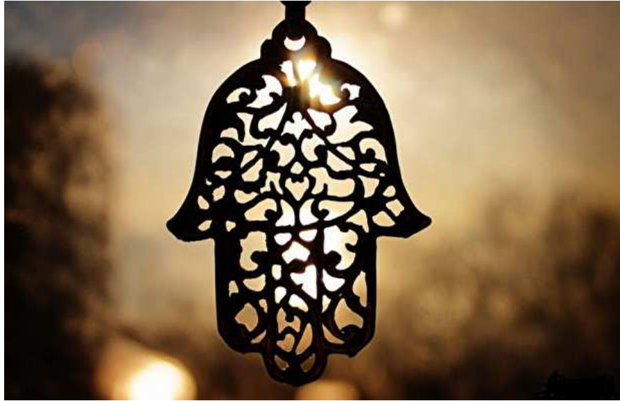
Resim 6. Pençe-i Al-i Aba motifi

Batı kökenli Avrupa'dan ithal edilmiş bir tür olmasına rağmen, insan eli biçimindeki bu tokmaklar Türkiye'de çok sevilen ve diğer kapı tokmaklarına göre daha yaygın olarak kullanılan bir tür olmuşlardır. Bu tercihte kuşkusuz iletişim kurma ve haber verme işlevine uygun olması kadar yukarıda belirtilen sembolik değerinin de büyük etkisi vardır. Ayrıca "Türk sanatında Hz. Peygamber, kızı ve damadı Ali ve torunlarını simgeleyen ve 'pençe-i al-i aba' denilen beş parmağı yan yana gösteren motif ile benzerliği dolayısıyla sevildiği ve yaygınlaşmış olduğu da düşünülmektedir" (Kolektif:1999: 279).