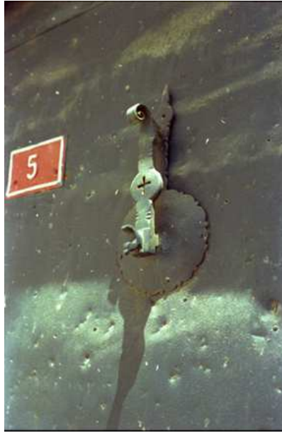
Resim 9. Üzerindeki haç motifinden bir Hıristiyan evine ait olduğu anlaşılan ve günümüzde kaybolmuş olan kuş başlıklı, sürüngen kuyruklu kapı tokmağı.

Bu insan eli biçimindeki kapı tokmakları dışında yaygın olarak görülen ikinci tipi ise soyut hayvan biçimli tokmaklar oluşturmaktadır. Yine çok değişik ölçülerde gördüğümüz bu tokmaklar da dövme tekniğinde yapılmış olup, genel olarak dikdörtgen bir demir parçasının üst kısmı kuyruk, alt kısmı baş şeklinde biçimlendirilerek tasarlanmışlardır.