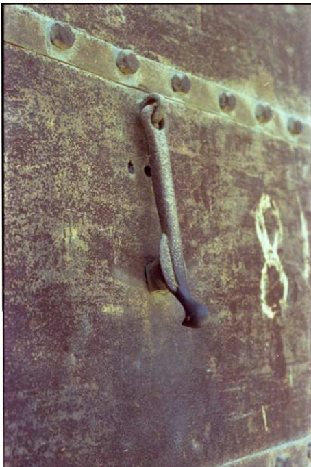
Resim 7. Pabuççu Hacı Bekir evi harem kapısında bugün yerinde olmayan kuşlu kapı tokmağı.

Batı kökenli Avrupa'dan ithal edilmiş bir tür olmasına rağmen, insan eli biçimindeki bu tokmaklar Türkiye'de çok sevilen ve diğer kapı tokmaklarına göre daha yaygın olarak kullanılan bir tür olmuşlardır. Bu tercihte kuşkusuz iletişim kurma ve haber verme işlevine uygun olması kadar yukarıda belirtilen sembolik değerinin de büyük etkisi vardır. Ayrıca "Türk sanatında Hz. Peygamber, kızı ve damadı Ali ve torunlarını simgeleyen ve 'pençe-i al-i aba' denilen beş parmağı yan yana gösteren motif ile benzerliği dolayısıyla sevildiği ve yaygınlaşmış olduğu da düşünülmektedir" (Kolektif:1999: 279).