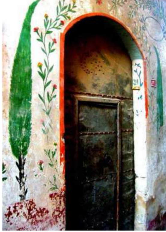
Resim 2: Tutya (çinko) sokak kapısı ve kabarlardan yapılmış ay-yıldız süsleme motifi örneği. Şanlıurfa.

“Kapı arkasındaki yan duvarlardan biri içerisine yerleştirilen ve ‘zormak’ [zoğnak] denilen ağaç ‘sürecek’ ile kapı emniyeti sağlanmıştır [...]