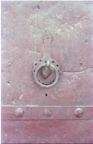
Resim 18-19: Geleneksel Urfa evlerinin kapı tokmaklarından günümüzde kaybolmuş daire biçiminde çekecek tipli iki örnek.

İkinci tip kapı halkaları ise, damla biçimlidir . Bu kapı halkaları bir kalp şeklini andırmaktadır (Resim 16).