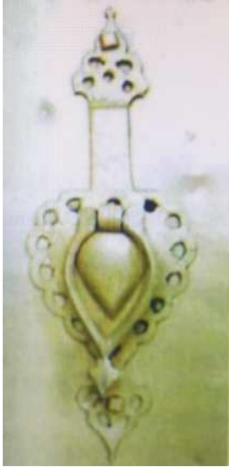
Resim 16: Damla Biçimli Kapı Halkası, Şanlıurfa.

olduğundan bu halkaların formlarının kısmen bozuk oldukları ve ayna ya da göbek üzerinde delerek süsleme yapılsa da halka üzerinde herhangi bir bezeme yapılmadığı görülmektedir.