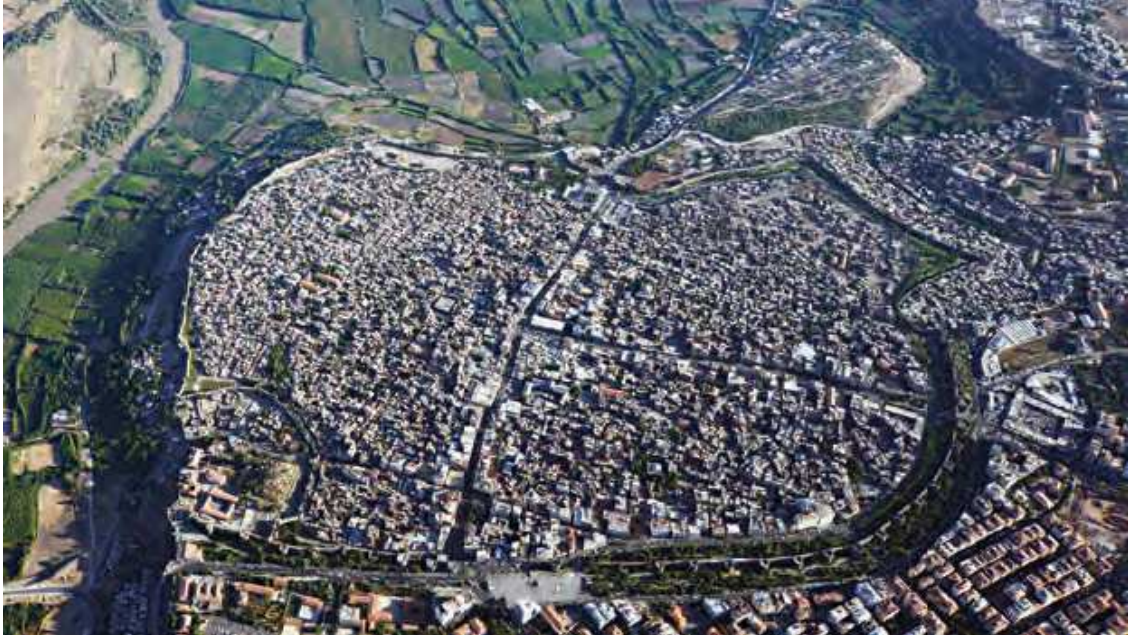
Resim 1. Diyarbakır Suriçi çatışma öncesi durum, Mart 2013

2015 yılında UNESCO Dünya Miras Listesi'ne giren "Diyarbakır Kalesi ve Hevsel Bahçeleri"yle birlikte tampon bölge olarak kabul edilen tarihi Suriçi yerleşim alanında yaşanan çatışmalı ortam; toplumun yaşamışlıklarıyla biçim alan ve tarihsel olarak süregelen ardışık değerleri toplumsal yaşamdan koparan, ritüellerle örülen belleği örseleyen, kentli haklarıyla ilgili olan her değere saldırıyı kendi açısından meşru gören bir olguyu tanımlamaktadır. Buna karşın Diyarbakır gibi kentler, insan eliyle kurulan en sofistike yaşam alanlarıyla birlikte coğrafi bir mekân olmanın ötesinde; toplumsal katmanlar ayrıtında şekillenen ve tarihsel bellekte aidiyet bulan mekânsal örüntülerin manzumesini temsil etmektedirler.