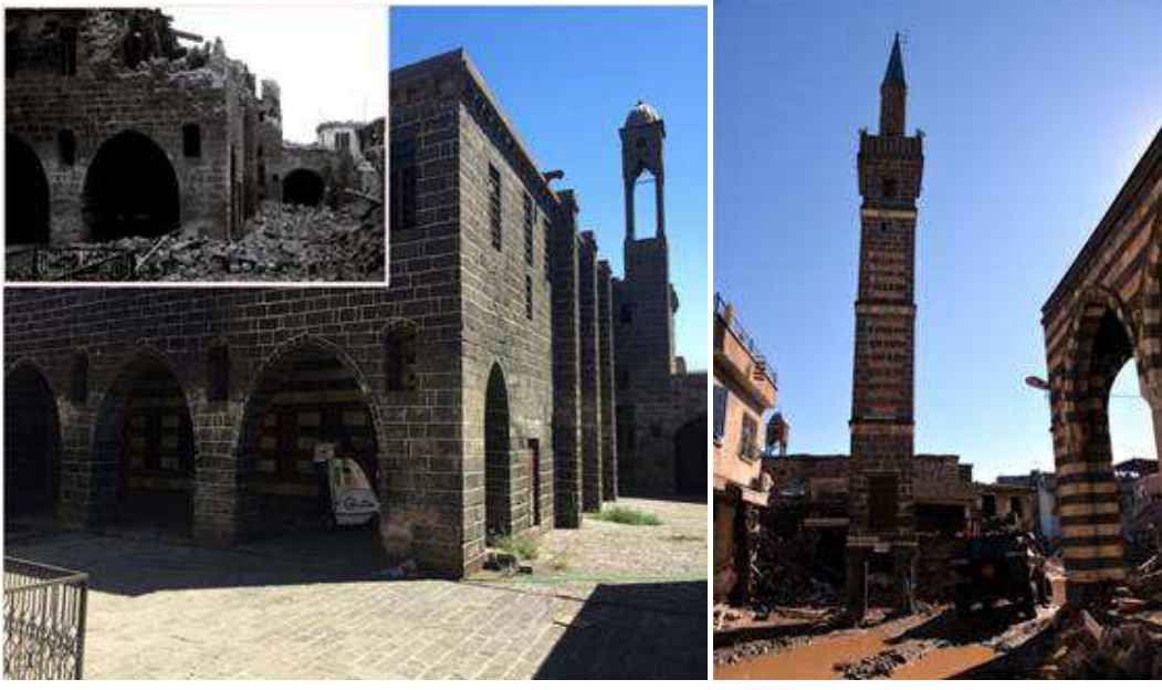
Resim 5-6. Diyarbakır Ermeni Kilisesi ve Dört Ayaklı Minare