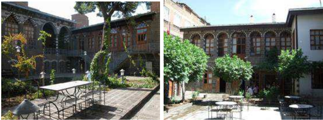
Resim 7-8. Cahit Sıtkı Tarancı ve Ziya Gökalp'ın Evleri

Türkiye'nin hızlı bir kentleşme sürecine girdiği 1950'li yıllardan beri süregelen göç, toplumsal ve kentsel yapılanma süreçlerini belirleyen etmenlerin başında yer almaktadır. Bu olağan süreçlere karşın Doğu ve Güneydoğu Bölgelerinde ortaya çıkan " kırsal iç göç", 1950'lili yıllardan bu yana yaşanan göçlerden farklı bir sosyolojik yapıyla tezahür etmiştir. Bu iç göç olgusu sosyal ve kültürel sonuçları itibariyle ülkemizin toplumsal ve tarihsel gerçeklerinden yalıtılmış bir perspektifte bakılması, birçok dramatik sorunu beraberinde getirmektedir (TESEV, 2005: 3). 1980'li yıllarda sözü edilen bölgelerde başlayan şiddet sarmalının izdüşümünün de 1990'li yıllarda kırsal bölgelerden ilçelere ve kentlere doğru yönelen göç dalgası; ülkemizde farklı bir tasavvurda ortaya çıkacak sosyal, iktisadi ve kültürel sorunların habercisi olmuştur. Sayıları yüz binleri bulan ve kimine göre de milyonlara varan bir insan topluluğu; şiddet ve terör kısılcığı arasında sıkışarak, köylerini ve yerleşim bölgelerini terk etmiş veya terk etmeye zorlanmıştır. Göçün yakıcı sonuçlarına karşı var olma mücadelesi veren göç mağdurları, yersel aidiyetlerinin sonlanmasıyla birlikte geldikleri yerin bilinmezliği düzleminde tutunabilecekleri mekânsal bir çevreyi tasavvur etmekte çaresiz bırakılmışlardır.