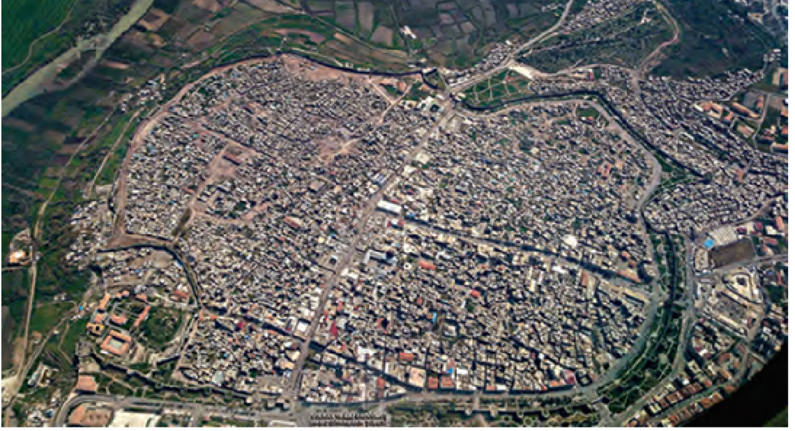
Resim 2. Diyarbakır Suriçi çatışma sonrası durum, Nisan 2016

önemli bir yeri olan Diyarbakır surlarını kentsel doku içinde görünür kılabilmek adına tüm gecekondu ve sura iliştirilen yapılardan temizlemiştir (Sami, 2016: 68).