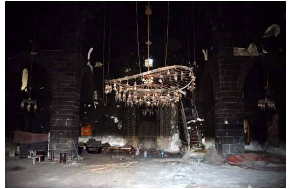
Resim 3-4. Diyarbakır Kurşunlu Camii (Dış ve iç görünüm)