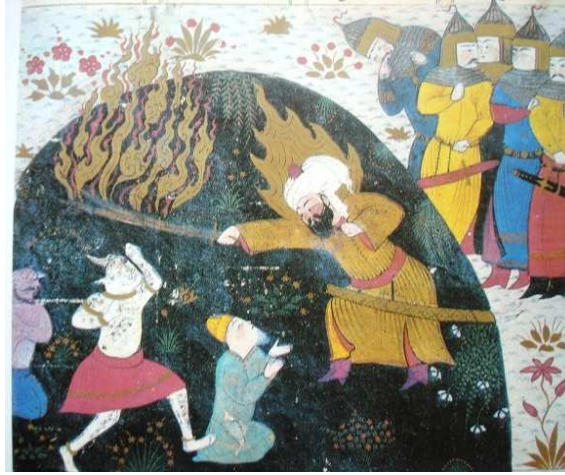
Resim 21. Hz. Ali'nin Şeytanları Yenmesi: Haveran Nâme, AKKoyunlu Türkmen Dönemi, Şiraz, 1476 [Tahran, Dekoratif Sanatlar Müzesi], (Elbehnisi, 1986: resim 85).