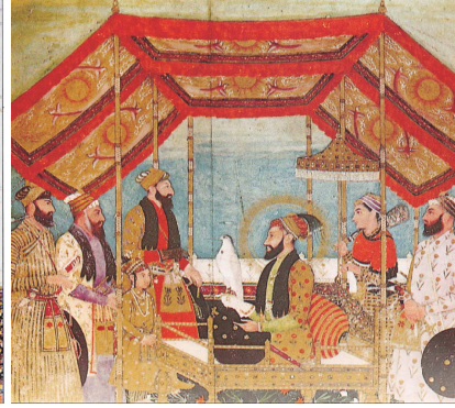
Resim 25. Orancezib ve oğlu Mohammed Azem: Mucmue-i Has, 1658 (Okşe, 1999: resim 441).