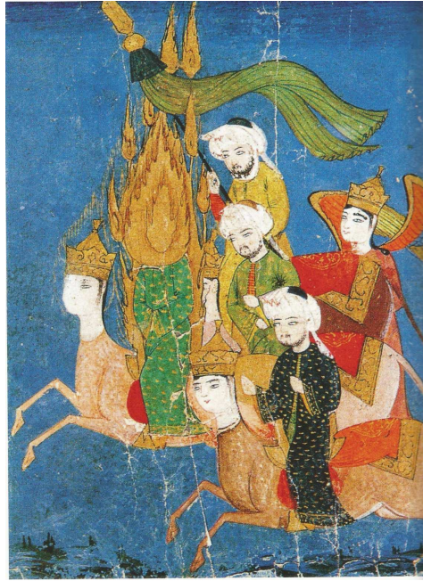
Resim 26 . Hz Muhammed, Halife Ebubekir ve öteki halifelerin gökteki yolculuğu: Ahvâl-i Kıyamet [BSB, Ms. Or. Oct. 1596] (And, 2014: 106).

Resim 29'de hale şekli zirvesini bulmuş, Burak atı üzerindeki peygamberin vücudundan çıkan ışık, keskin çizgilerle belirtilmiş olsa da, bütün göğü tutmuş durumdadır. Resim 30'da haleler sanki nur bulutları gibi her yer yere dağılmış, dünyayı hale kaplamış durumdadır. İslam resmi kendi tarzı ile halede diğer dinlerden farklı özelliklere sahip olmuştur.