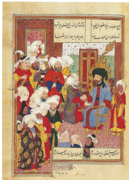
Resim20. Nehriyan Savaşından Sonra Hz. Ali, Hadikat'üs-süeda [BNF, suppl, turc 1088](And, 2014:99)

İslam resminde melekler için de fazla kutsal hale kullanılmaz. Selçuklu döneminde hazırlanan Ertiryak (Resim17) ve Makam-i Hariri gibi kitaplarda melekleri de hale ile görmek mümkündür (Resim 22). Fakat sonraki dönemlerde melekler de halesiz yapılmıştır. Resim Zübdet-üt Tevarih'e ait olan resim 23'in üst kısmında Hz. İbrahim ve oğlu kutsal hale ile otururken sağ tarafta onlarla buluşmaya gelen Cebrail (Melek), halesiz görünmektedir.