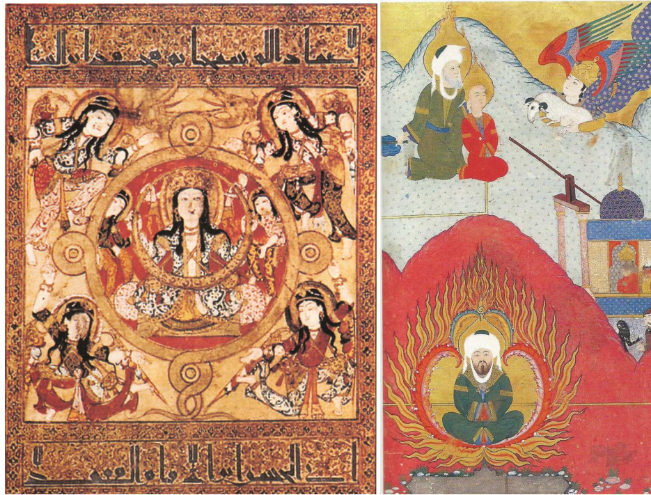
Resim 22. Oturan Sultan ve Maiyetindekiler: Kitab el-Tiryak, Calinus, 13. yy. civarı [Kuveyt Milli Kütüphanesi], (Okuşe, 1999: resim 64).