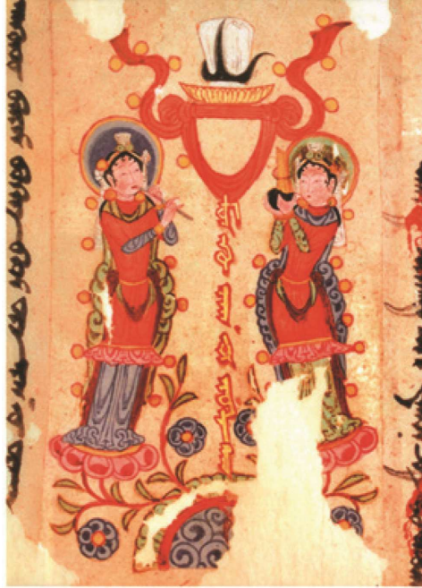
Resim 4. Manici duvar resmi: Turfan (Elahi, 1381: 93)