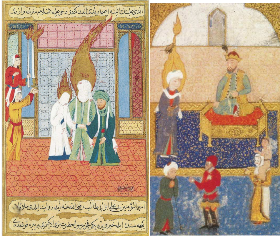
Resim 18. Hz Muhammed, kızı Fâtma ile yeğeni Hz. Ali'yi evlendiriyor: Siyer-I Nebi [TEİM, 1974] (And, 2014: 159)