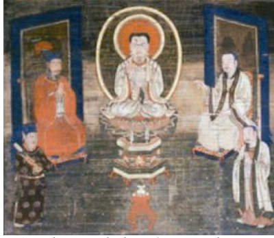
Resim 3. Mani Ortada vaaz derken: (Baran Tekin, 2014: 118)

İran ve Türk resim sanatını etkisi altına alan dinlerin biri Maniheizmdir. Manicilikte iki tanrıya inanılır. Biri aydınlık ve ışık tanrısıdır ki iyiliklere neden olur, diğeri karanlık tanrısıdır ki kötülüklerin kaynağıdır (Latıfpur, 2015:85). Manici resimlerde kutsal kişilerin yüzlerinin çevresinde hale simgeleri kullanıldığı görülmektedir. Ancak bunların Hıristiyan sanatından Manici sanata geçmiş mi yoksa Mitraizmde kullanılan simgelerden, bu konu tartışmalıdır (Rehber - Purmend, 2013, 1992h:70) (Örnek: Resim 3-4).