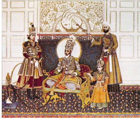
Resim 24. II. Bahadır Şah: Mecmue-i Has, 1838, (Okşe, 1999: 448).