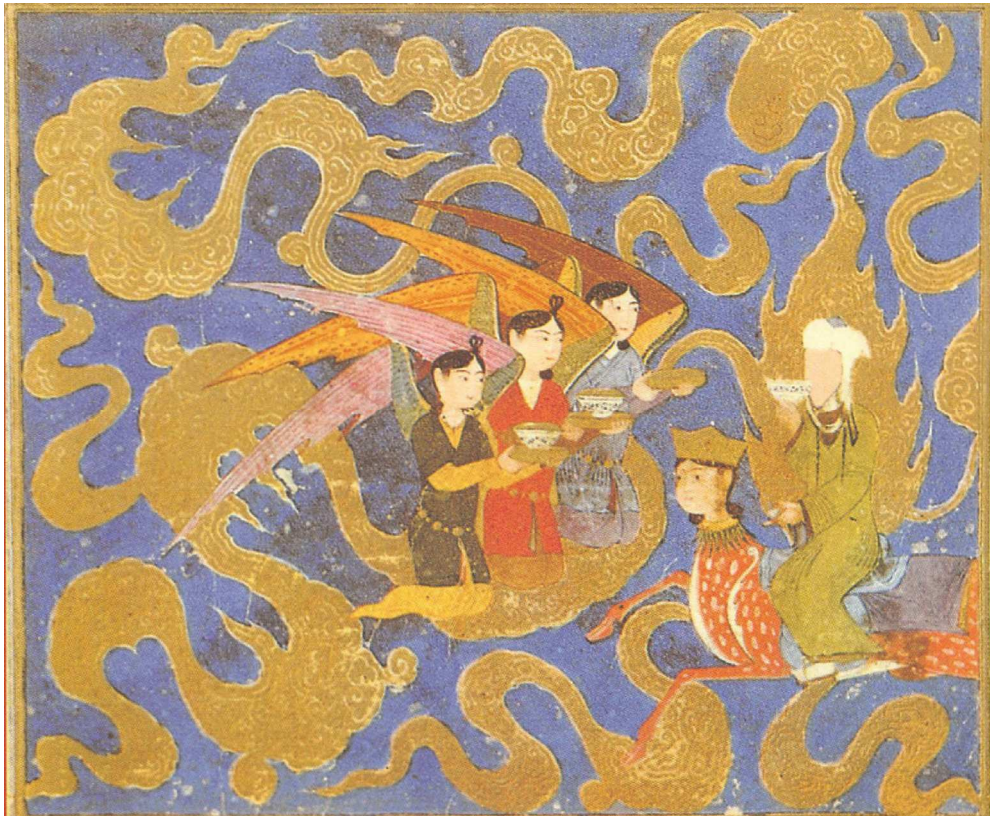
Resim 30. Melekler peygambere üç kase ile içecek ikram ediyorlar, birinci süt, ikincide şarap, üçüncüde bal var, Miraçname, Herat, 1436, Paris Etnik Kütüphanesi (Okça, 1999: resim477).