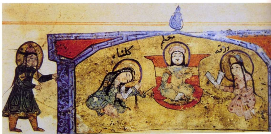
Resim 16. Varka ile Gülşah Okulda: Varka ile Gülşah Kitabından, 1250 yılı civarı, Konya, [Topkapı Sarayı Müzesi Kitaplığı H. 841/ 4b İstanbul] (Başkan, 2009: 58)