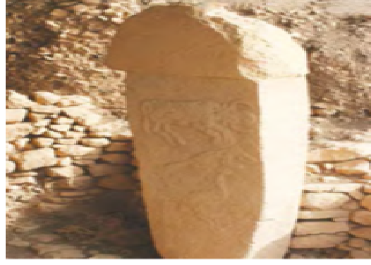
Resim 5: Göbeklitepe'de Boğa, Turna Tilki kabartmalı stel

Anadolu'da tarım yaşamına geçen ve boğa tasvirlerinin görüldüğü bir diğer coğrafya da Konya Çatalhöyük'tür. Çatalhöyük'te kutsal mekan olarak tanımlayabileceğimiz birçok yapının duvarında boğa başları bulunmaktadır. Özellikle Çatalhöyük'te bir tapınakta bulunan kabartmada, doğum pozisyonundaki figürün altında üç boğa başı tasvir edilmiştir. Eskiçağ toplumlarında boğa eril unsurları simgeleyen bir tanrı olarak kabul edilmekteydi. Doğum sahnesinin hemen yanında yer alması bereket ve Anatanrıça ile bir ilgisinin olduğunu akla getirmektedir. Fakat bazı bilim adamlarına göre, Çatalhöyük'te görülen bu boğa başlarını sadece dinsel düşüncelerle açıklamak çokta olası değildir. Bu resimlerin aynı zamanda toplumdaki ekonomik ve sosyal yapıyı da açıklamakta da kullanıldığı varsayılabilir. Boğanın tarım hayatına geçmiş Neolitik toplumlar için sadece tanrısallığı ifade etmediği aynı zamanda, verimliliğinin devam etmesi için yapılan bir ritüelin parçası olduğu kabul edilmekteydi. Duvar süslemelerinde kullanılan boğanın erkek verimlilik sembolü, ayrıca Savaş ve Gök Tanrısı olarak Eskiçağ inanç dünyasında önemli bir yer tuttuğu söylenebilir (Hodder, 2014 ; 45).