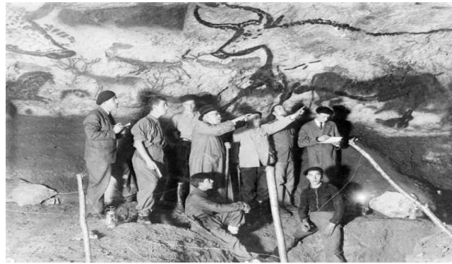
Resim 1. H. Breuil, Lascaux Mağarası'nın 1940 yılında bulunuşundan sonra orada inceleme yaparken (Erişim: arkeolojigazetesi.com/?p=509 ).

Mağara Sanatının avcılık büyü sisteminin bir parçası olduğu iddiası ilk defa Fransız Katolik Rahibi Abbé Breuil tarafından (1877-1961) ortaya atılmıştır. Abbé Breuil yaşamının çoğunu Mağara sanatı araştırmalarına adanmıştır ve mağara sanatıyla ilgili ilk olarak sanatın iki ardışık ve farklı döngü içinde geliştiğini iddia etmiştir. Fakat bu fikrin tutarsızlığı sonradan kanıtlanmıştır. Örneğin bazı çizimleri bükülmüş perspektif adı verilen hayvana ait herhangi bir parça boyun ya da hayvanın boynuzu olarak kabul ediyordu. Daha sonraki araştırmalarında Breuil mağara resimlerinde sanatçıların takıntılı bir biçimde büyük etoburlar çizdiğine inandı ve çalışmalarını bu yönde geliştirdi (Leakey, 2006; 113, 120, Lewin, 2006; 432, Braidwood, 2008:106, Childe, 2010; 24-52, Gray, 2010; 50, Bogucki, 2013; 163-165).