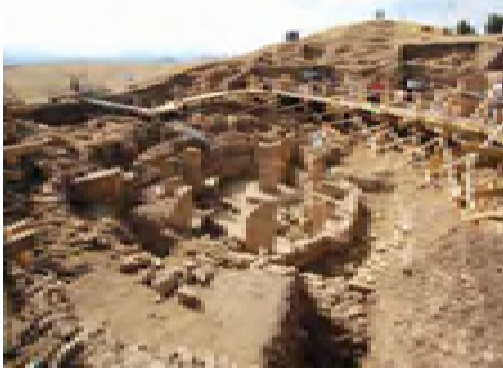
Resim 4: Göbeklitepe Tapınağı Şanlıurfa (Erişim: www.kulturportali.gov.tr )