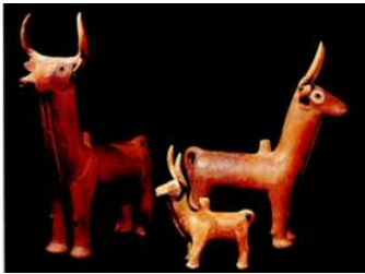
Resim 8: Eski Hitit Krallık Dönemi İnanıktepe'de Boğa Figürleri