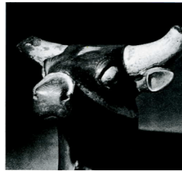
Resim 9: Pişmiş Topraktan yapılmış Boğa Başı

(Erişim: http://www.sanatduvari.com/hitit-donemi-heykelleri/ )