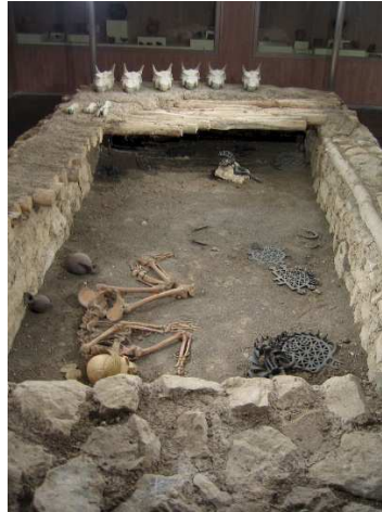
Resim 6. Çorum Alacahöyük Kral Mezarı (Erişim: https://www.hittitemonuments.com/index-t.htm )

Kalkolitik döneme gelindiğinde ise, boğa tasvirleri stilize bir hale bürünmüş ve yalnızca boynuz şeklinde çizilmeye başlanmıştır. İlk tunç dönemi Anadolu'sunda dinde önemli bir değişiklik yaşanmamış, Kalkolitik dönemde görülen inanışının benzeri bir inanç sistemi geliştirmişlerdir. Alacahöyük Kral Mezarlarında ve Horoztepe'de bulunan boğa ve geyik heykelcikleri hala bir totemizm inancının devam ettiğini göstermektedir. Bu iki hayvandan boğanın erkek tanrısı, geyiğin ise tanrıçayı simgelediği kabul edilir. Özellikle Alacahöyük Kral Mezarlarında bulunan eserlerde boğa ve geyik tasvirleri önemli bir yer tutmaktaydı ayrıca MÖ 3 binde Anadolu da hayvan biçimli tanrılara tapım oldukça yaygındı (Akurgal, 2002; 7-8, Alp, 2011; 7-8, Kınal, 1998; 51-52).