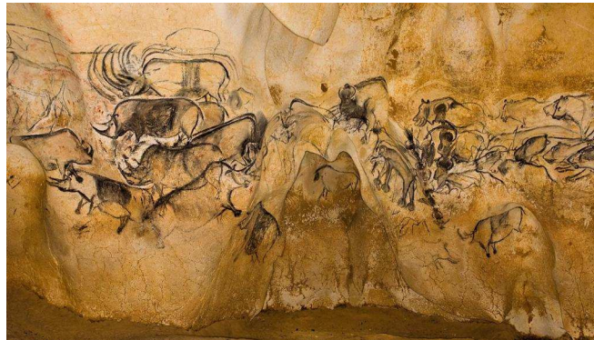
Resim 2. Güneydoğu Fransa'da Mağara sanatının en iyi temsil edildiği yerlerden biri olan Chauvet Mağarası. (Erişim: arkeofili.com/chauvet-magarasi-sanilandan-10-000-yil-daha-eski-olabilir/ )

Paleolitik mağara sanatının yapılış nedeninin tam olarak belirlenemeyeceği gibi bunu tek bir sebeple açıklamakta son derece yanlıştır. Ayrıca Paleolitik dönemin yaşantısına tanıklık edileseydi bile, mağara duvarlarına yapılan resimlerin bir bütün olarak anlamını kavramaya olanak olmazdı. Çünkü bazı kültür öğeleri ait oldukları kültür dışında bir anlam taşımayan şifreli bazı simgelerden oluşmaktadır (Leakey, 2006; 113, 120, Lewin, 2006; 432, Braidwood, 2008:106, Childe, 2010; 24-52, Gray, 2010; 52, Bogucki, 2013; 163-165).