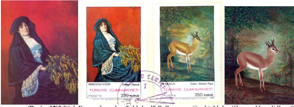
(Resim 12)" Türk Ressamlarından Tablolar I" Pulları ve orijinal tablolar (Osman Hamdi Bey, Şeker Ahmet Paşa).

Şeker Ahmet (Ali) Paşa , 1841 yılında Üsküdar'da doğmuş ve 1906 da vefat etmiştir. Üsküdar'da eğitim hayatına başlamıştır. Dokuz yıl süren bu ilk tahsil devresinden sonra, 1855 yılında sınaola Tıbbiye Mektebi ne girdi. Sınıfları pekiyi derece ile geçen ve bu arada resme karşı gösterdiği üstün kabiliyeti anlaşılan sanatçı, henüz on sekiz yaşında iken, öğrencisi olduğu Tıbbiye mektebinin resim öğretmenliği yardımcılığına tayin edilmiştir. Meydana getirdiği eserleri ile güzel sanatlarla ilgili olan Sultan Abdülâziz'in dikkatini çekmiş, onun emri ile 1864 yılında Paris'e gönderilmiştir. 1871 yılında döndükten sonra yüzbaşı rütbesi ile tıbbiye mektebinin resim öğretmenliğine tayin edilmiştir. 1872 de Türkiye'nin ilk resim sergisini Şeker Ahmet Paşa açmıştır (Tollu, 1967: 1-4).