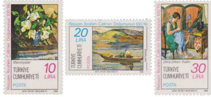
(Resim 19) "Çallı'nın Doğumunun 100. Yılı Anma Pulları".

1982 yılında (17 Mart) Ressam İbrahim Çallı'nın doğumunun 100. Yılı anısına bastırılan pullarda sanatçıya ait "Balıkçılar", Manolyalar" ve "Dikiş Diken Kadın" tabloları konu edilmiştir.