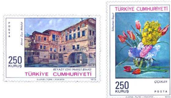
(Resim 18) “Türk Ressamlarından Tablolar 6” (Ahmet Ziya Akbulut, Süleyman Seyyit).

15 Haziran 1973’te Türk Ressamları ve Tablolar 6. seri pulları basılmıştır. İki adet olarak basılan pulların görseli; Süleyman Seyyit’in eseri “Çiçekler”(lale ve sümbüller) ve Ahmet Ziya Akbulut’un “Beyazıt Eski İmaret Binası” isimli tablosudur.