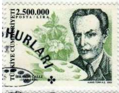
(Resim 27) "Türk Meşhurları Serisi" İbrahim Çallı Pulu.

2002 yılı (3 Haziran) Türk meşhurları dizisinde bu kez ressam olarak pullarda yer alan sanatçı İbrahim Çallı olmuştur. Bu serideki pullarda da görseller portreler şeklinde tasarlanmıştır 10 .