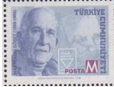
(Resim 26) "Türk Meşhurları Serisi" İ. Hulusi Görey Pulu.

1992 yılından sonra bir sanatçı ya da tablo konulu pul altı yıl aradan sonra 1998 yılında çıkarılmıştır. 31 Aralıkta tedavüle giren pulların arasında (Türk Meşhurları temalı) ressam ve Cumhuriyet döneminin ilk grafik sanatçısı İ. Hulusi Görey'in portresi de yer almaktadır 9 .