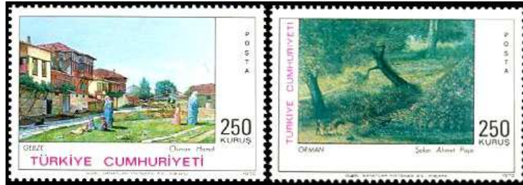
(Resim 15) "Türk Ressamlarından Tablolar 5" (Osman Hamdi Bey, Ş. Ahmet Paşa).

1972 15 Mayıs'da çıkarılan Türk Ressamlarından Tablolar 5 serisinde, 1970 yılında da olduğu gibi Osman Hamdi Bey ve Şeker Ahmet Paşa'nın Tabloları kullanılmıştır.