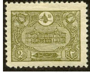
(Resim 9) Resimli ilk posta pulu