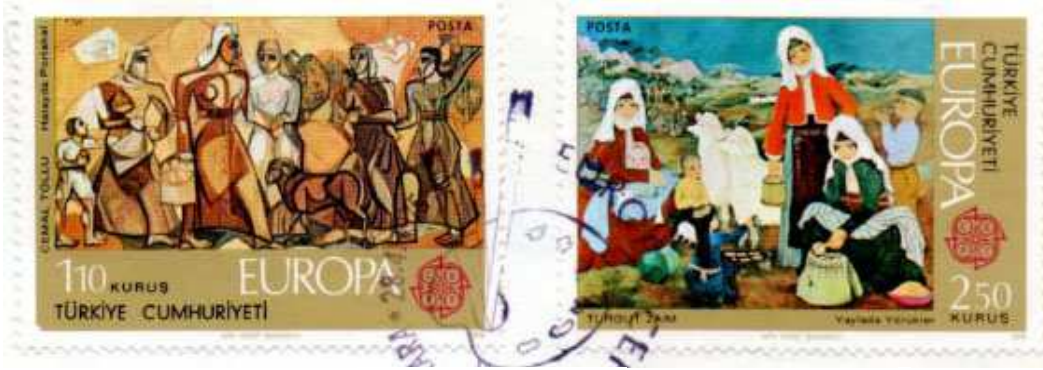
(Resim 19) "Europa CEPT Tablolar Serisi" (Cemal Tollu, Turgut Zaim).

Cumhuriyet'in ilk kuşak sanatçıları arasında yer alan Cemal Tollu , çocukluğundan itibaren var olan resim ilgisinin sonunda 1919 yılında Sanayi-i Nefise Mektebi Âlisi'ne (Güzel Sanatlar Akademisi) kayıt olmuştur. 1921-1923 yılları arasında Kurtuluş Savaşı'na katılmak üzere eğitimine ara vermiş ve İstiklal Madalyası ile onurlandırılmıştır. Savaşın sonra 1925'e kadar Edirne'de vagon onarım atölyesinde çalışmış ve nihayet 1925'te okuluna yeniden başlayabilmiştir. 1926 yılında mezun olmuş ve bir süre Elazığ Öğretmen Okulu'nda resim öğretmenliği yaptıktan sonra 1928 yılında Paris'e gitmiştir. Yurda döndükten sonra 1933 yılında Türk resim sanatı tarihinde önemli bir yeri olan D Grubu'nun kurulmasına katkı sağlamıştır (Üstünipek, 2015: 15).