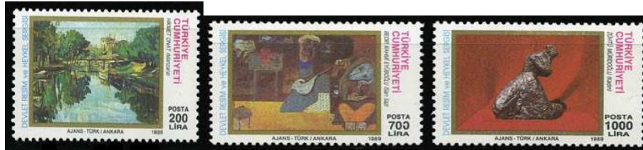
(Resim 22) "Devlet Resim Heykel Sergisi" (H. Onat, B. Rahmi Eyüboğlu, Z. Müridoğlu).

30 Ekim 1989'da "Devlet Resim Heykel Sergisi" adıyla basılan pullar aynı zamanda bu konuyla da basılan ilk pullardır. Seride üç adet pul yer almaktadır. Bu pullarda görseli oluşturan eserler; Hikmet Onat "Manzara" ve Bedri Rahmi Eyüboğlu "Sarı Saz" adlı tabloları ile Zühdü Müridoğlu'nun "Kadın" adlı heykelidir.