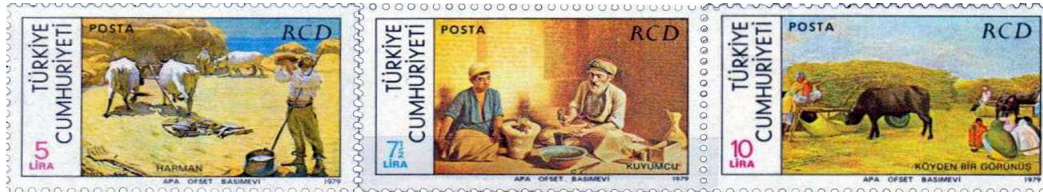
(Resim 19) "Türkiye-İran Pakistan İşbirliği" Pulları (Namık İsmail, Moḥammad Gaffarı, Üstat Allah Baksh).

1979 yılında (5 Eylül) tablolar konusuna yine bir işbirliği anma pulunda rastlanılmaktadır. Türkiye-İran Pakistan arasındaki işbirliği RCD tablolar konulu pullar üç puldan oluşmaktadır.