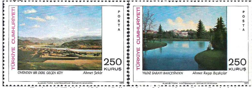
(Resim 14) "Tablolar 3" Serisi Pullar (Ahmet Şekür, Ahmet Ragıp Bıçakçılar).

1971 yılı Aralık ayında piyasaya sürülen tablolar serisi Cumhuriyet dönemi pullarında 3. Seriyi oluşturmaktadır. Bu seride de yine iki sanatçının eserine yer verilmiştir. Bu eserler; Ahmet Şekür'ün "Peyisaj" ve Ahmet Ragıp Bıçakçılar'ın "Yıldız Köşkü" adlı çalışmalarıdır.