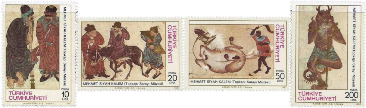
(Resim 21) "Tablolar" (Mehmet Siyah Kalem).