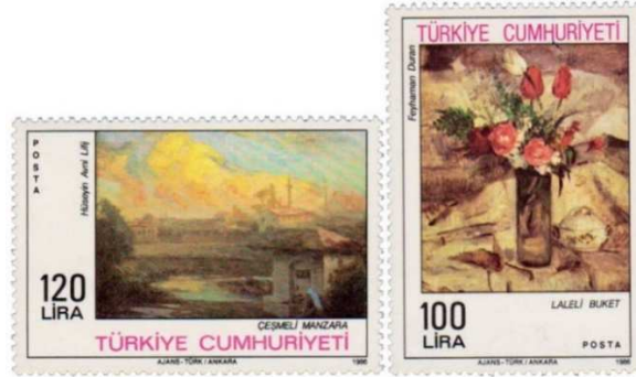
(Resim 20) "Tablolar VII. Seri" (Avni Lifiş, Feyhaman Duran).

Tablolar serisinin VII.'si 1986 yılının 22 Ekiminde yine iki pul olarak tedavüle çıkmıştır. Bu yılın konu edilen tabloları; Feyhaman Duran'ın "Laleli Buket" tablosu ve Hüseyin Avni Lifiş'in "Çeşmeli Manzarasıdır.