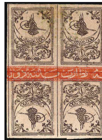
(Resim 4) 1863 tuğra basımı,