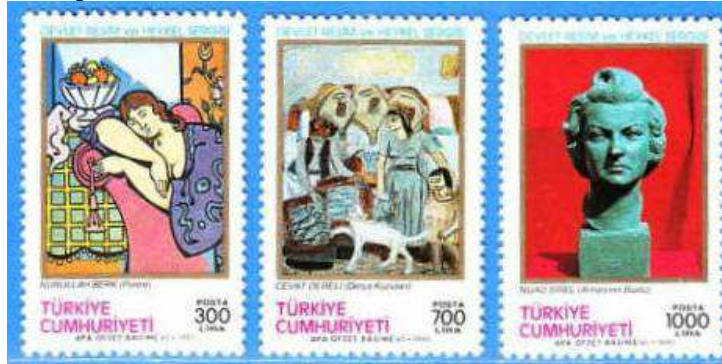
(Resim 24) "Devlet Resim Heykel Sergisi" (Nurullah Berk, Cevat Dereli, Nijad Sirel).

1990 yılının bir başka sanat konulu pulu 22 Ağustosta üç adet olmak üzere hayata geçirilen Devlet Resim Heykel Sergisi pullarıdır. Bu konu aynı zamanda 1989'dan sonra ikinci kez ele alınmıştır. Nurullah Berk (Portre) ve Cevat Dereli (Derya Kuzuları) tablolarının yanı sıra Nijad Sirel tarafından yapılan büst (Annesinin Büstü) bu dönem pullarının konuları olmuştur.