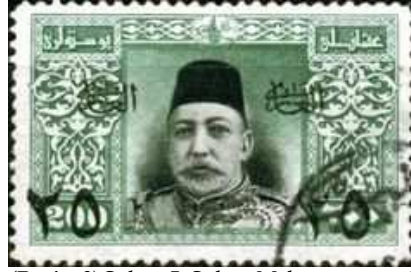
(Resim 9) Sultan 5. Sultan Mehmet portresi