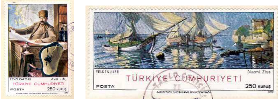
(Resim 13)" Türk Ressamlarından Tablolar II" Pulları (Avni Lifij, Nazmi Ziya).

1970 yılında 15 Aralıkta "Türk Ressamlarından Tablolar II" serisi Yayınlanmıştır. I. Seride olduğu gibi yine iki farklı puldan oluşmaktadır. Pullarda yer alan tablo görselleri; Avni Lifij'in Fevzi Çakmak adlı eseri ve diğeri de Nazmi Ziya'nın Yelkenliler adlı tablosudur.