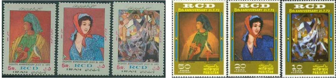
(Resim 17) Türkiye-İran-Pakistan İşbirliği Serisi, İran ve Pakistan Pulları