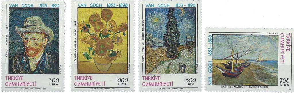
(Resim 23) "Van Gogh'un ölümünün 100 yılı" pulları.

1990 (29 Temmuz) Van Gogh'un ölümünün 100 yılı nedeniyle sanatçının tablolarına yer verilen dört adet pul üretilmiştir. Pullarda yer alan tablolar sanatçının 1887 yılında yaptığı "Oto portresi", 1888 tarihli "Günebakanlarla Vazo" (ayçiçekleri) ve "Saintes Marines'de Kayıklar" , 1890 yılında yaptığı "Servili yol ve Yıldızlar" isimli tablolarıdır.