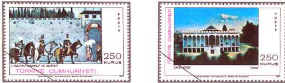
(Resim 14) "Türk Ressamlarından Tablolar 4" (Eyüplü Cemal).

Türk Ressamlarından Tablolar 4 serisi 1971 Kasım ayında tedavüle çıkmıştır. Ressam (Eyüplü) Cemal tarafından yapılan; I. Sultan ve Maiyeti ile Çinili Köşk isimli tablolar pullarda konu olarak kullanılmıştır.