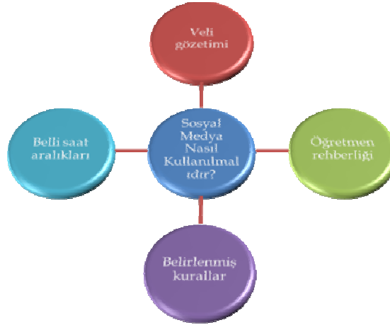
Şekil 4: Sınıf Öğretmenlerinin Sosyal Medyanın Öğrenciler Tarafından Nasıl Kullanılması Gerektiğine Dair Düşüncelerinden Oluşturulan Model

kullanılması gerektiğine dair oluşturulan model şekil 4’te gösterilmiştir.