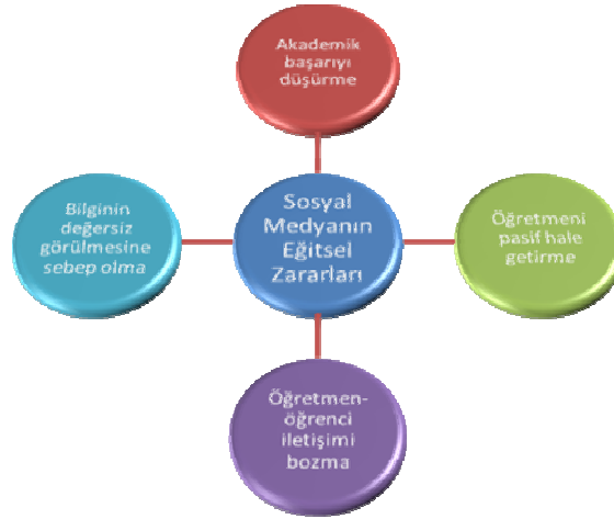
Şekil 2: Sınıf Öğretmenlerinin Sosyal Medyanın Eğitsel Zararlarına Dair Düşüncelerinden Oluşturulan Model

Sınıf öğretmenlerinin hakkında en çok söylem geliştirdiği tema sosyal medyanın yararları teması olmuştur. Öğretmenler sosyal medyanın sosyal ve eğitsel açıdan yararları alt başlıkları altında toplam 96 söylem dile getirmişlerdir. Bu söylemlerin 70 tanesi sosyal medyanın eğitsel yararları kısmında dile getirilen söylemlerdir. Sosyal medyanın yararları alt başlıklar altında tablo 7 ve 8’de ayrıca sosyal medyanın eğitsel yararları kısmında öğretmenlerin söylemlerinden ortaya çıkan sosyal medya kavramı ve eğitim süreçlerine nasıl dâhil edileceğine ilişkin model şekil 3’de gösterilmiştir.