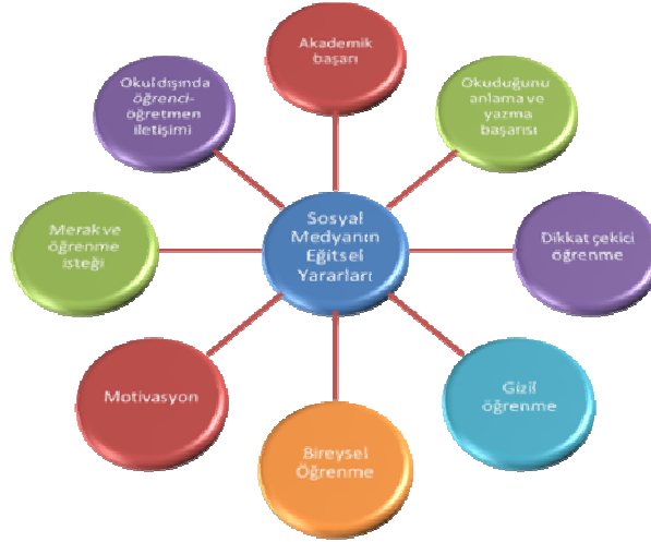
Şekil 3: Sınıf Öğretmenlerinin Sosyal Medyanın Eğitsel Yararlarına Dair Düşüncelerinden Oluşturulan Sosyal Medya ve Öğretim Kavramlarının İlişkisini Gösteren Model

A: “ Mesela düşünün bir dakika. Öğrenciler facebook’ ta vakit geçirmeye bayılıyorlar. Öğretmen bir grup kursa sınıf adına ve devamlı ders değil eğlenceli paylaşımlar yapsa. Ama zaman zaman ders içerikleri ve öğrencileri tartışmaya itecek konular atsa. Böylece öğrenci o eğlenceli paylaşımların arasında bilgi kırıntılarını da zevkle belleğine katacaktır.”